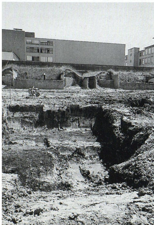
Links: Die ABZ kaufte das Land Altlasten-bereinigt: Die Beseitigung führte zu einem halben Jahr Verzögerung.

Bei Redaktionsschluss waren noch einige nicht subventionierte Wohnungen mit 4½ bis 6½ Zimmern frei. Dokumentation bestellen bei: ABZ, Postfach, 8055 Zürich Telefon 01/455 57 60 E-Mail: vermietung@abz.ch