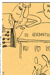
Illustration: Max Spring

Wer auf Wohnungssuche ist, fragt sich häufig, nach welchen Kriterien die Wohnungen vergeben werden. Sind die Förderung von Familien oder von einkommensschwachen Gruppen wegleitend? Je nach Genossenschaft sind die Kriterien für die Wohnungsvergabe sehr unterschiedlich.