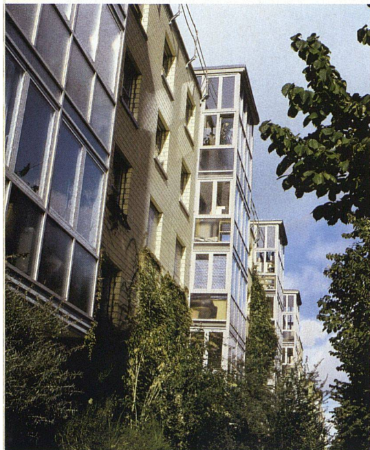
Die Siedlung Davidsboden wurde Mitte der Achtzigerjahre von den Architekten Erny, Gramelsbacher, Schneider (Basel) für die Christoph Merian Stiftung und die Helvetia Patria Versicherungen entworfen. 360 Menschen leben hier in – zumindest teilweiser – Selbstverwaltung.

desamtes für Wohnungswesen und der beiden Bauträgerschaften des Davidsbodens das neuartige Wohnmodell evaluiert und ist auf eine Fundgrube überraschender Erfahrungen und Einsichten gestossen, die aufhorchen lassen.