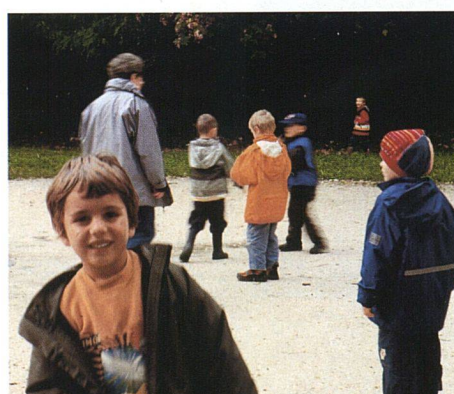
Bis zu 140 Kinder und Jugendliche aus der Siedlung treffen sich in den Höfen. Dazu kommen SpielkameradInnen aus dem Quartier, das sonst wenig Freiräume besitzt.