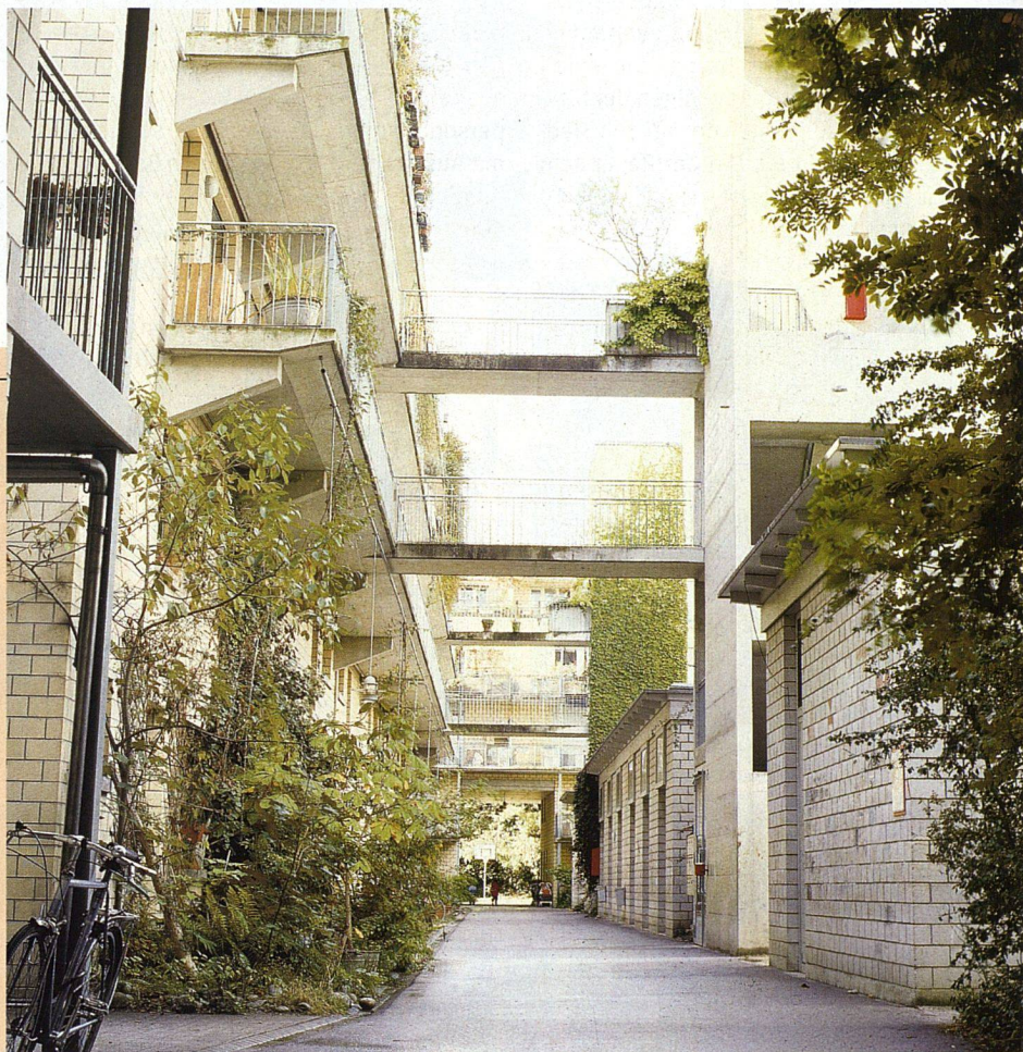
Hofgasse entlang der Gebäudezeile zwischen den Höfen.

Die Mieterschaft wusste durchaus mit ihren Freiheiten umzugehen: Sie kreierte keine schlecht nutzbaren Grundrisse, schuf im Gegenteil ein vielfältiges Angebot an unterschiedlichen Wohnungseinteilungen, das auch zehn Jahre nach Bezug noch gefragt ist und bisher keine baulichen Korrekturen nach sich zog. Wer die betont einfache Grundausstattung der Wohnungen – «kein Zwangskomfort» lautete die Devise der Bauträgerschaft – durch Mehrausstattungen ergänzen wollte, zusätzliche Küchenelemente etwa oder teurere Abdeckungen, kannte die finanziellen Konsequenzen im Voraus: Der Rückstattungsanspruch für Eigeninvestitionen