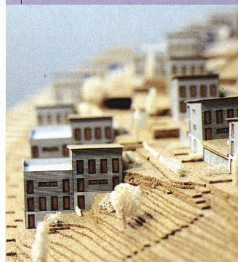
Modell der Herisauer Holzhaussiedlung.

Nebst Holz bergen auch andere Baustoffe ein grosses Ökologisierungspotenzial. Bisher fehlte auf dem Markt ein glaubwürdiges Label für Bauprodukte, das als Orientierungshilfe dienen könnte. Diesen Sommer wurde mit «natureplus» ein internationales Label lanciert. Zur Trägererschaft gehören u.a. TÜV und WWF. Mehr Info: www.natureplus.com , www.econcert.de