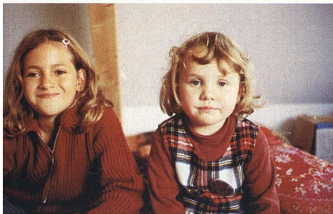
Die beiden Halbschwestern verstehen sich ausgezeichnet und teilen sogar das Bett miteinander.

Der Alltag einer Patchwork-Familie ist etwas komplizierter