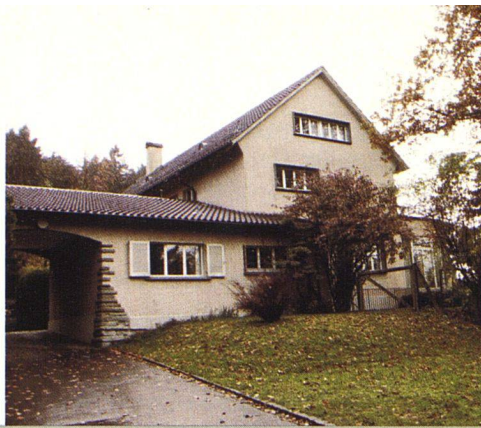
Grosszügigkeit innen und aussen.