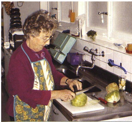
Vorbereitungen fürs Mittagessen.