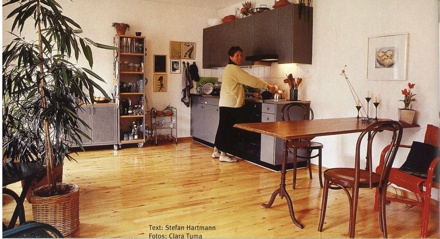
Text: Stefan Hartmann

Ein Wohnmodell für Einzelpersonen-Haushalte