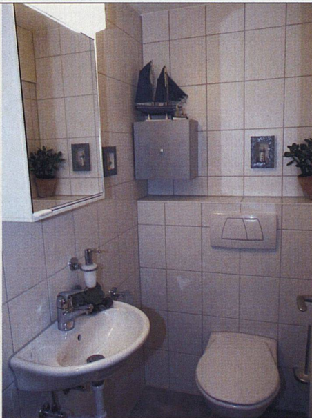
Vollständig renoviertes Bad, auch hier setzt man auf Helligkeit.

Ohr für Mieteranliegen – blieben doch die Mieter während der Sanierung in ihren Wohnungen. Wer es einrichten konnte, fuhr allerdings in die Ferien oder zog zu Bekannten. Dank dieser Massnahmen stiess die Sanierung auf keine grösseren Widerstände, sondern fand breite Unterstützung und wichtige Mitarbeit – was sich auch finanziell positiv auswirkte.