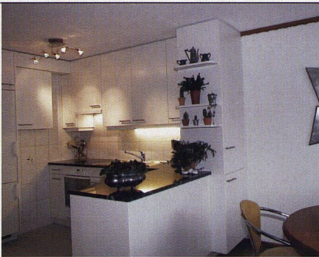
Helle Farben, Granitabdeckungen und eine gegen das Wohnzimmer offene Struktur zeichnen die umgebauten Küchen aus.