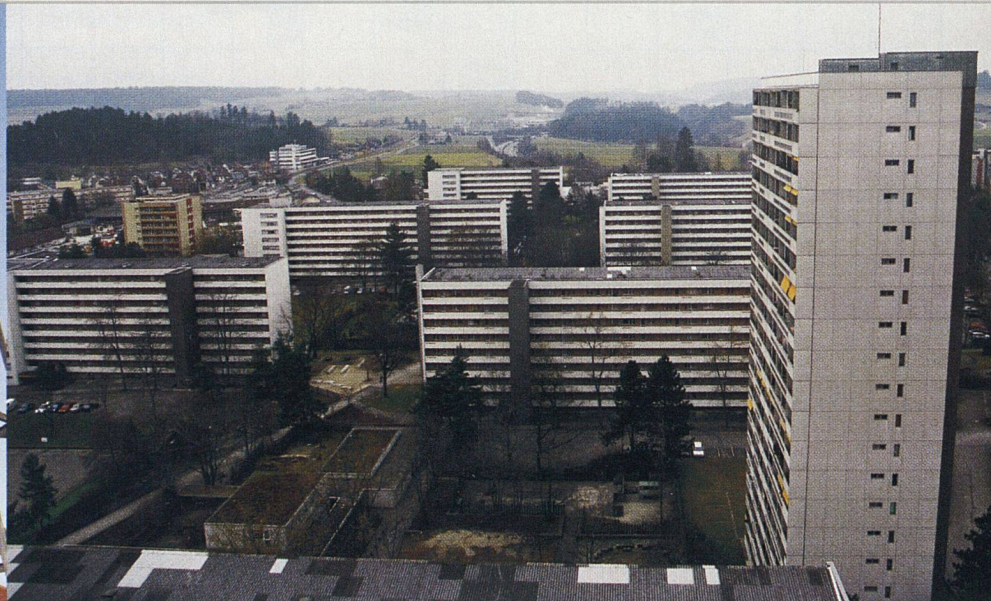
Die BewohnerInnen schätzen den grosszügigen Aussenraum ganz besonders.

Das Herz des Tscharnerguts ist der Dorfplatz mit Restaurant und verschiedenen Geschäften.