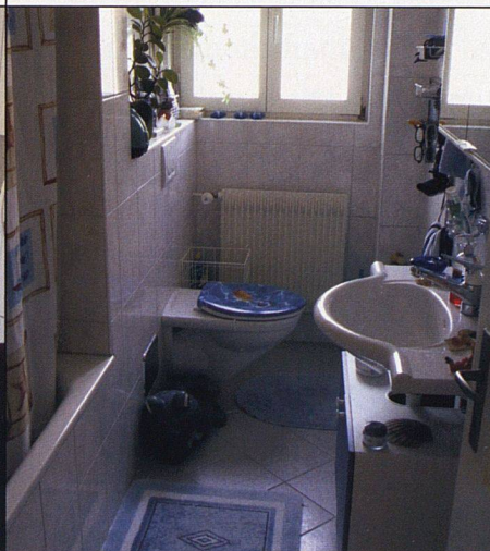
Die Bäder wurden vollständig erneuert.

im Grundriss unverändert. Das dritte Zimmer jedoch, zusammen mit Bad und Küche gegen die lärmige Verkehrsader ausgerichtet, liess sich nur ungenügend nutzen. Deshalb beschloss man, die Zwischenwand zur Küche zu entfernen und eine Wohnküche einzurichten. Auf die Tür vom Korridor zur Küche liess