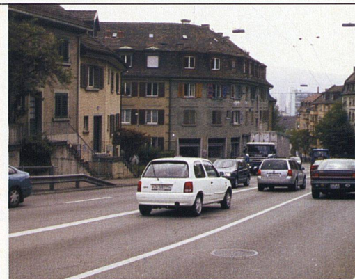
Visualisierung: Zeitech GmbH

Dank geschickter Visualisierungen konnten sich die MieterInnen mit dem Projekt vertraut machen.