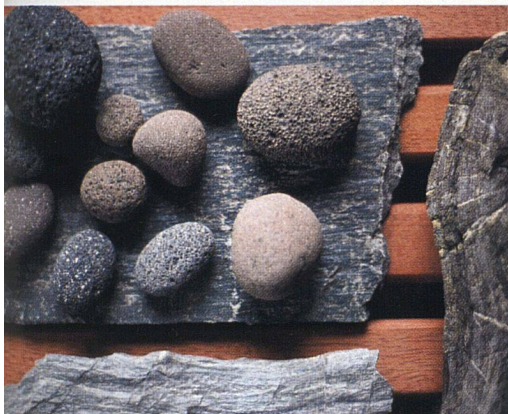
Vulkangestein von Lipari, Gämse von der Zainenfurggel und Baumpilze.

Zum grössten Teil der Sammlung ist ihr Verhältnis aber unsentimental. Den würde sie bei einem Umzug ohne Mühe loswerden. «Ich kanns ja nicht lassen und wäre bald wieder so weit», lacht sie und gesteht die Utopie aller Sammelwütigen: «Eigentlich träume ich von grossen, leeren Räumen!» wohnenextra