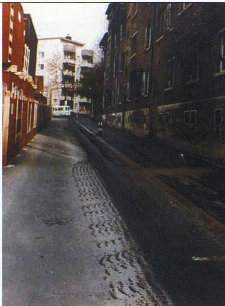
Die Wildbachstrasse vor ...