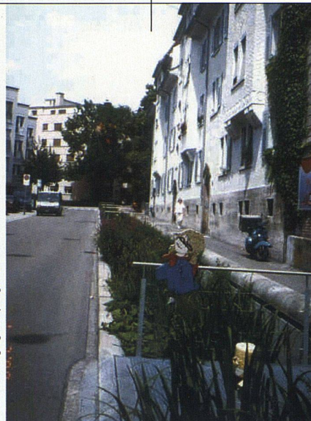
... und nach der Bachöffnung. Der Nebelbach wertet die Umgebung ganz klar auf.