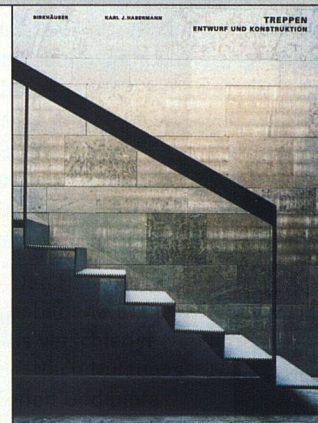
Karl J. Habermann Treppen Entwurf und Konstruktion 224 Seiten, 200 Farbabb., 128 CHF Birkhäuser – Verlag für Architektur, Basel 2003

der Basisbaustoffe Holz, Stahl und Beton. Den Hauptteil machen reich bebilderte aktuelle Beispiele aus verschiedenen Ländern aus. Nach Nutzungstypen gegliedert und umfassend dokumentiert, geben sie wertvolle Anregungen für die Praxis. Der Siedlungsbau ist zwar einmal mehr spärlich vertreten, doch sind einige der gezeigten Treppen in Bürobauten oder öffentlichen Gebäuden durchaus auch in Wohnsiedlungen denkbar.