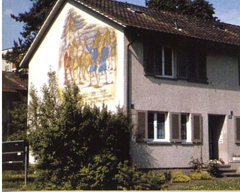
Die Reiheneinfamilienhäuschen wirken nach der Modernisierung frisch und zeitgemäss.