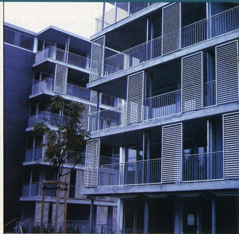
Ein Beispiel für innovative Fassadengestaltung: Die Wohnüberbauung Dennlerstrasse mit den Schiebe-Lamellen von Hammer Metallbau.

Weil im bitterkalten Winter 1929 nicht nur der See zufror, sondern auch der Boden bis tief in den Frühling hinein pickelhart war, konnten die Gärtner wochenlang nicht arbeiten und mussten schmerzliche Lohnausfälle und -kämpfe hinnehmen. Aus der Not schlossen sie sich zu einer Genossenschaft zusammen. So entstand die Gartenbau-Genossenschaft Zürich (GGZ), die diesen November ihr 75-jähriges Bestehen feiern kann. Glücklicherweise ging die Gründung der GGZ Ende der 20er-Jahre mit der Entstehung zahlreicher Wohnbaugenossenschaften einher, die denn