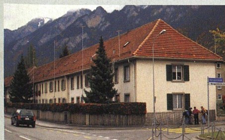
Die Wohngenossenschaft Ringstrasse Chur ersetzt Reihenhäuser aus den 20er-Jahren.

Balz Christen, SVW, Bucheggstrasse 109, 8057 Zürich, Telefon 01 360 26 55