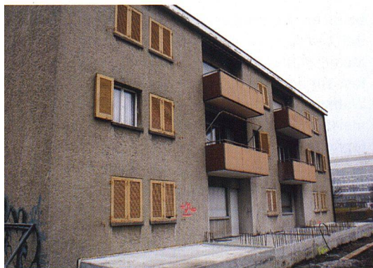
Beim Haus Eisenbahnstrasse 4, das diesen Herbst als letztes fertiggestellt wird, ist noch der frühere Zustand sichtbar. Bereits ist das Fundament für die Erweiterung und die Balkone gelegt.