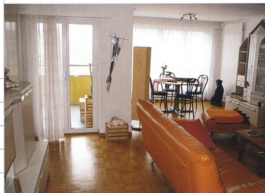
Dank der Anbauten und einer neuen Raumaufteilung entstanden bis zu 32 Quadratmeter grosse Wohnzimmer.

Nach 44 Jahren war die Erneuerung überfällig: Die Wohnbaugenossenschaft Lerchenfeld in St. Gallen entschied sich deshalb nicht nur für eine Rundum-Sanierung, sondern schaffte mit Vorbauten mehr Wohnraum. Aus Kostengründen verzichtete sie jedoch auf eine Maximallösung.