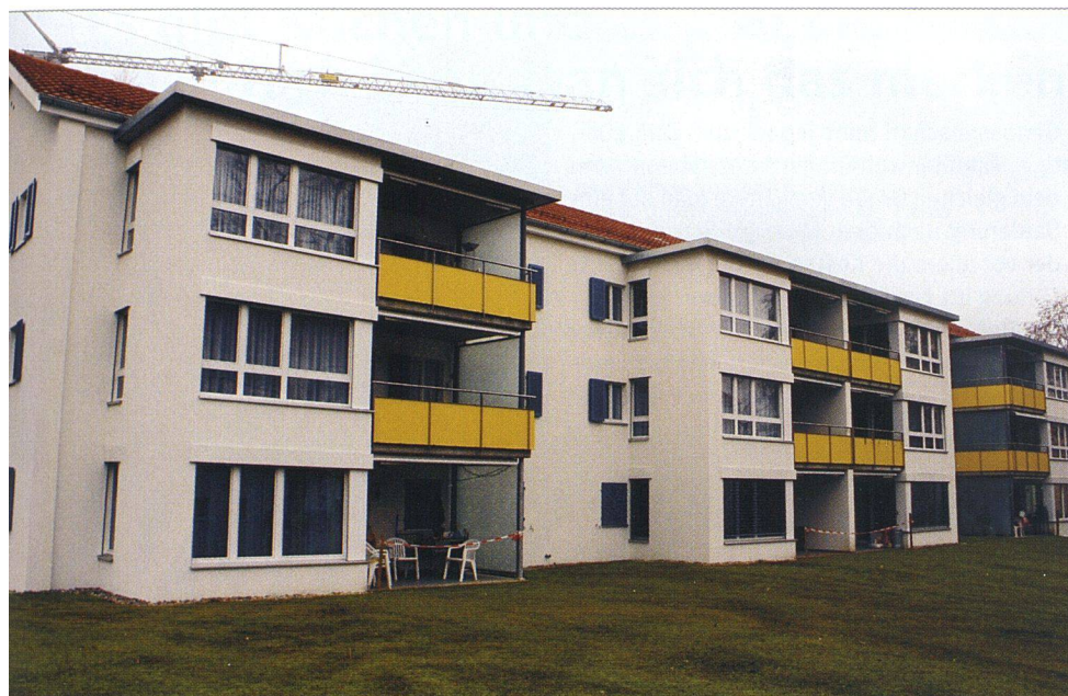
Anbauten und neue Balkone werten die Siedlung Lerchenfeld auf.

VON RICHARD LIECHTI ■ Konkurrenzlos günstig waren die 36 Wohnungen in den vier ältesten Häusern der Siedlung Lerchenfeld, die in einem industriell geprägten Umfeld westlich vom St. Galler Stadtzentrum liegt. Weniger als 600 Franken monatlich kostete eine Vierzimmerwohnung. Das liegt zum einen am gemeinnützigen Charakter des Vermieters, der Wohnbaugenossenschaft Lerchenfeld. Zudem waren die Wohnungen seit ihrer Erstellung im Jahr 1959 nie renoviert worden. Dies entsprach der Strategie früherer Genossenschaftsvorstände: Um die Mieten tief zu halten, griff man kaum ein, ja, die Mieterinnen und Mieter legten beim Malen und Tapezieren selbst Hand an.