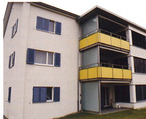
Die neuen gedeckten Balkone bieten rund neun Quadratmeter Fläche.