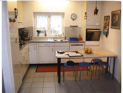
Blick in die neue Wohnküche.

Genossenschaft habe jedoch zum Ziel, günstige Familienwohnungen anzubieten. Aus dem gleichen Grund verzichtete man auf eine Sanierung nach dem Minergie-Standard, bei der vor allem die Kosten für die kontrollierte Lüftung ins Gewicht gefallen wären. Die Zinsaufschläge liegen bei durchschnittlich 500 Franken, so dass eine Viereinhalbzimmerwohnung (rund 100 m 2 ) in den zwei sanierten Blöcken neu 1020 bzw. 1120 Franken netto kostet. Trotz dieser Aufschläge in der Grössenordnung von 90 Prozent waren nur wenige Wegzüge zu verzeichnen. Die Mietzinse sind für St. Gallen immer noch günstig. Dies liegt auch am fairen Baurechtszins, den die Genossenschaft der Landeigentümerin, der Ortsgemeinde Straubenzell, zu entrichten hat. Und, wie Niklaus Koster betont, natürlich am gemeinnützigen Charakter einer Genossenschaft, die auf die Abschöpfung von Gewinnen verzichtet und günstige Rahmenbedingungen bei der Finanzierung an die Mieter weitergibt. ☺