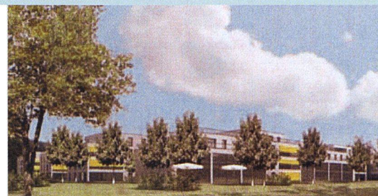
Die Punktbauten sind von durchlaufenden Grünflächen mit Laubgehölzen umgeben. So bildet die Siedlung einen fließenden Übergang zum angrenzenden Wald.

Dominanz des angrenzenden Waldes gewahrt werden. Auf städtische Aussenräume wird bewusst verzichtet. In den acht Häusern entstehen insgesamt 90 Wohneinheiten, die von der Zweieinhalbzimmer-Kleinwohnung bis zur Sechseinhalbzimmer-Familienwohnung, vom Reihnhaus bis zu Terrassen-, Attika- und Gartenwohnungen die ganze Vielfalt des Wohnens abdecken. Der Neubau wird ab 2009 voraussichtlich in zwei Etappen erstellt. (rom)