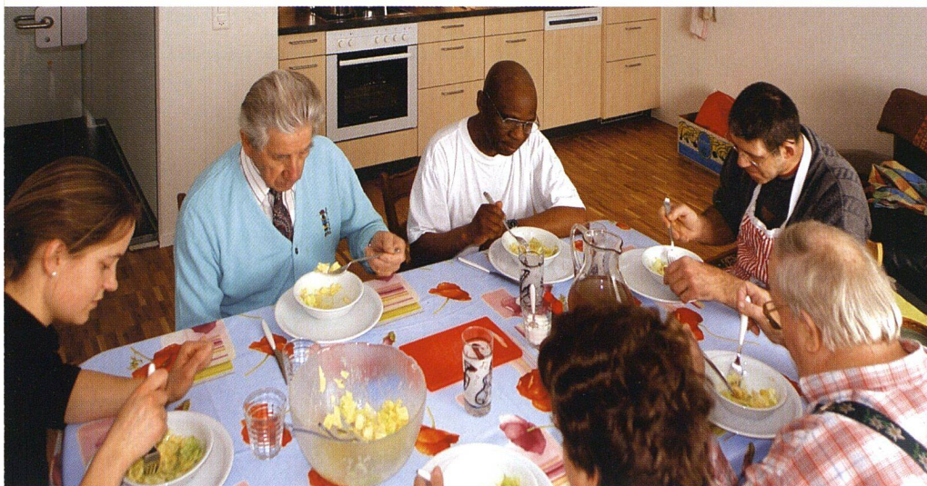
Der Mittagstisch sorgt für eine Tagesstruktur.

net sind, durch die Zusatzversicherungen der Krankenkassen oder allenfalls durch Ergänzungsleistungen gedeckt. Zudem wird ein Mahlzeitendienst, ein Putzdienst und – vor allem für Diabetes-Kranke wichtig – regelmässige Fusspflege angeboten.