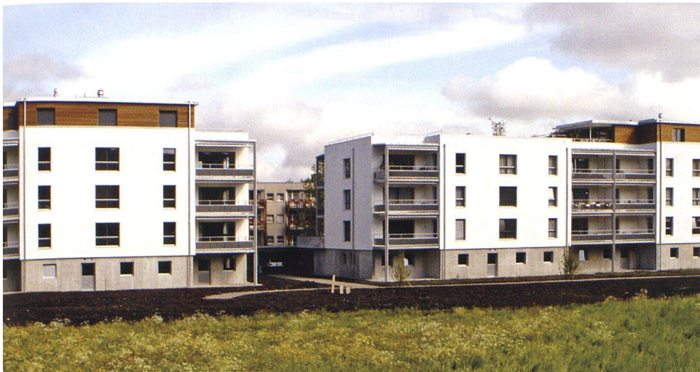
Ansprechende Architektur an zentraler Lage beim Bahnhof RBS Schönbühl: Die Siedlungen Badstrasse und Lyssstrasse.