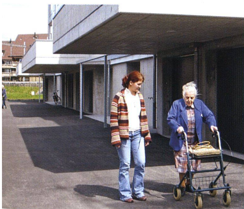
Begleitung auch beim Spaziergang.

Schönbühl wurde mit Mitteln aus dem Genossenschaftskapital, mit privaten Darlehen und einer günstigen Bankhypothek gedeckt. Das Konzept Begleitetes Wohnen ist in verschiedener Hinsicht wegweisend. Betagte und Pflegebedürftige können länger in ihrer Gemeinde, in einer eigenen Wohnung oder in der Nähe ihrer Kinder leben, sie knüpfen in den Gemeinschaftsräumen leichter soziale Kontakte, organisieren zusammen etwa Spielnachmittage, einen Brunch, einen Dia-Abend oder ein gemeinsames Singen. Durch die zentrale Lage der Wohnungen sind Bahnhof, Läden, Bank, Post, Gemeindeverwaltung oder Café auch mit dem Rollstuhl oder mit Gehhilfen gut zu erreichen. Psychisch Kranke finden eine stabilisierende Tagesstruktur, indem sie am Mittagstisch teilnehmen oder in die Vorbereitungsarbeiten fürs Essen einbezogen werden. Und für die Spitex ergeben sich durch die pflegegerechte Gestaltung der Wohnungen und die Konzentration der Pflegebedürftigen in der Nähe der Spitexzentrale im alten Bahnhof Schönbühl Einsparungen bei der Arbeitszeit von bis zu dreissig Prozent.