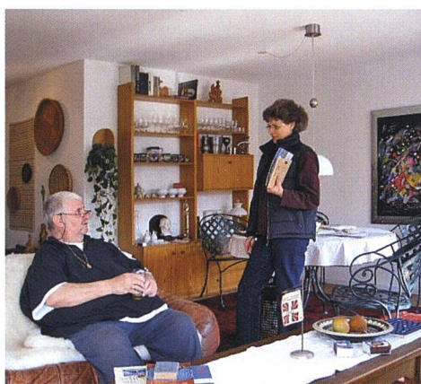
Besuch der Spitex-Schwester.

VIelfältiges Betreuungsangebot. Den Bewohnerinnen und Bewohnern der Genossenschaftswohnungen stehen die Leistungen der Spitex täglich von 7 bis 23 Uhr zur Verfügung. Nachts besteht zwar ein Pikett-Dienst, die Bewohnerinnen und Bewohner müssen aber die Nacht grundsätzlich ohne Betreuung verbringen können. Am Tag brauchen sie gelegentlich Hilfe, kommen aber während mindestens einiger Stunden alleine in ihrer Wohnung zurecht. Die Kosten für die Pflege durch die Spitex übernimmt die Grundversicherung der Krankenkassen. Die hauswirtschaftlichen Leistungen werden, wenn sie ärztlich verord-