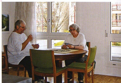
Im Aufenthaltsraum treffen sich die Bewohnerinnen und Bewohner.

eine innovative Kombination von genossenschaftlichem Bauen und Pflege aufzubauen und die Mittel für den Bau von 35 pflegegerechten Wohnungen aufzubringen, das ist aber eine Erfolgsgeschichte, die mehr als nur bemerkenswert ist.