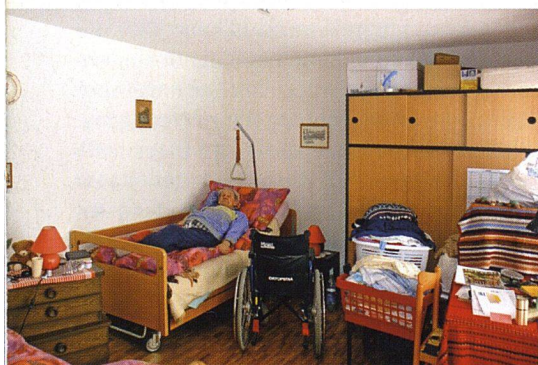
Die Bewohnerinnen und Bewohner erhalten eine auf ihre Bedürfnisse abgestimmte Betreuung.

KNOW-HOW WEITERGEBEN. Die Entscheidung, wer eine der begehrten Wohnungen der Genossenschaft Begleitetes Wohnen erhält, fällt die Genossenschaft auf Antrag von Marianne Iff, die als ausgebildete Gesundheitsschwester und Spitex-Leiterin eine Bedarfsabklärung