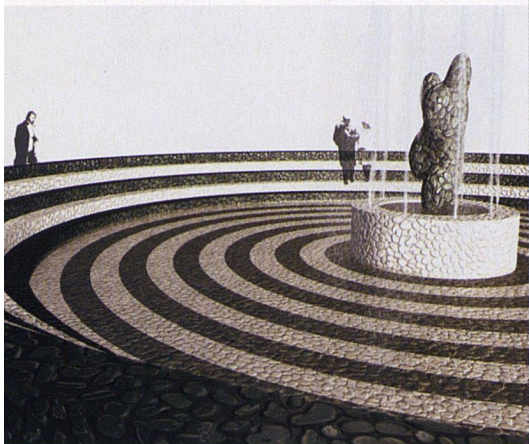
Der vom Künstler Ugo Rondinone entworfene Brunnen soll zu einem Treffpunkt für das ganze Quartier werden.

die dafür nötige kontrollierte Wohnungslüftung, und ein Teil des Warmwassers wird durch Sonnenkollektoren auf den Dächern der Häuser erwärmt. Das Minergielabel erhält die Siedlung dennoch nicht. Denn der Nahwärmeverbund, aus dem sie ihre zusätzlich nötige Heizenergie bezieht, ist bezüglich Energieerzeugung nicht auf dem neusten Stand. Geheizt wird dort noch mit Öl statt mit umweltfreundlicherem Holz oder Erdwärme. Doch die Erneuerung dieser Heizzentrale wird bald einmal fällig werden. Sobald dies geschehen ist, wird die Siedlung Werdwies nachträglich mit dem Minergielabel zertifiziert.