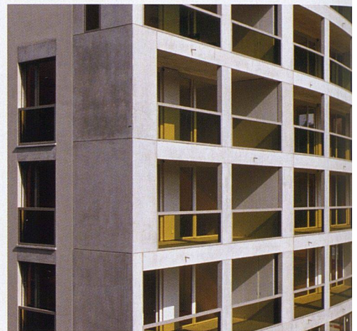
Blick auf die grosszügigen Terrassen.

Und das obwohl er sich bei den Fassaden selbst für Regelmässigkeit entschied: In gleichbleibendem Rhythmus heben sich grüne Glasbrüstungen vor den graubraunen Fassaden aus Sichtbeton und Verputz ab. Dafür sind die Volumen abwechslungsreich. Die sieben Bauten setzen sich aus drei unterschiedlichen Gebäudetypen zusammen und reihen sich entlang der Bändlistrasse und dem Grünauring. Zueinander stehen sie jeweils versetzt, was wechselseitige Zwischenräume schafft, die den Siedlungsraum zu ihrer Umgebung hin öffnen und verzahnen. «Wir haben versucht, innerhalb der Siedlung eine Art Dramaturgie der Baukörper zu schaffen», sagt Adrian Streich. Das Mittel dazu sind einerseits weite Platzräume, andererseits enge,