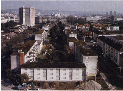
Das Werden eines Ersatzneubaus. Die rund 40-jährigen Bauten an der Bernerstrasse wurden abgebrochen, nun wächst die Neubausiedlung Werdwies heran.