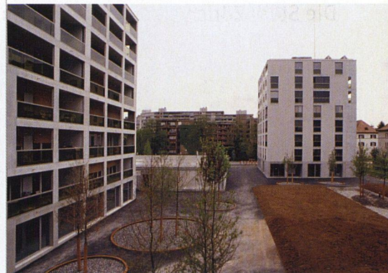
Viel Sorgfalt gilt der Gestaltung des Aussenraums.

VON ULRIKE SCHEITLER ■ Eines der grössten Wohnbauprojekte, die derzeit in der Stadt Zürich verwirklicht werden, ist der Ersatzbau für die Wohnsiedlungen an der Bändlistrasse im Zürcher Grünau-Quartier. Die neu «Werdwies» genannte Siedlung umfasst sieben achtgeschossige Häuser mit total 152 Wohnungen. Die Grünau zählt nicht zu den bevorzugten Wohngebieten: Das zu Zürich Altstetten gehörende Gebiet wird durch die Autobahn, die Limmat und Sportplätze begrenzt und ist deshalb von der Umgebung etwas isoliert. Soziale Probleme und eine hohe Fluktuation trugen in jüngerer Zeit zum angekratzten Image des Quartiers bei.