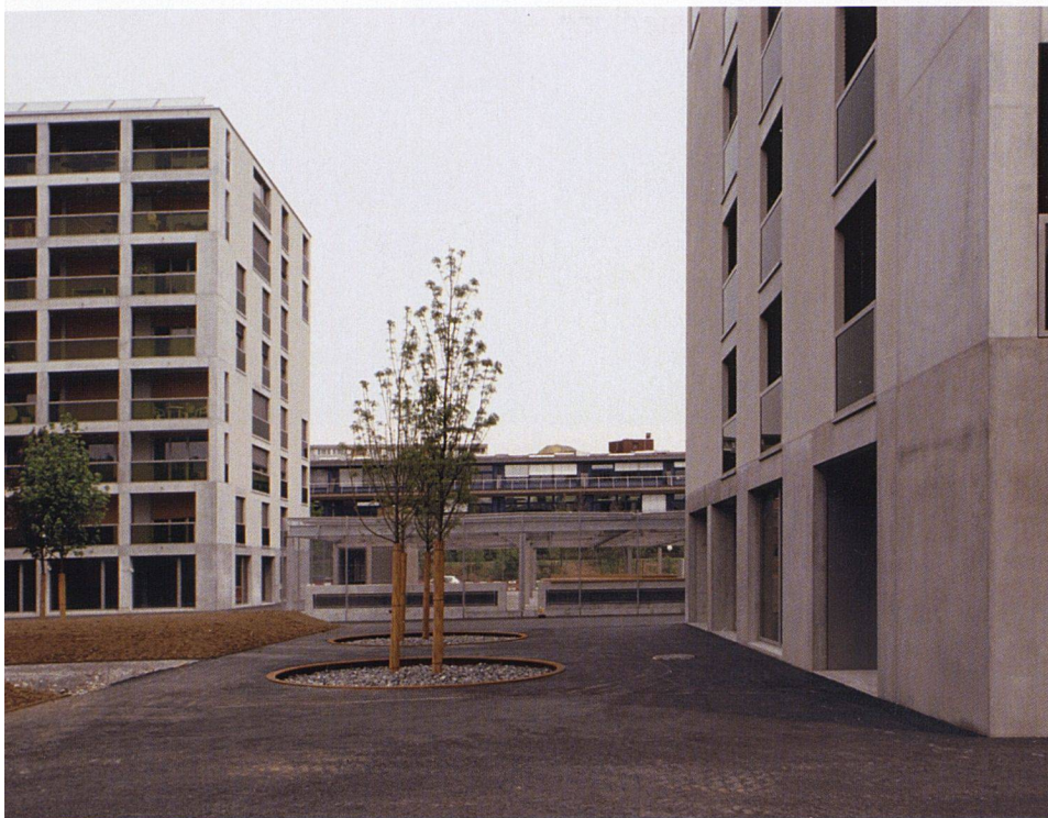
Zwei der sieben achtgeschossigen Bauten mit insgesamt 152 Wohnungen sind fertig.