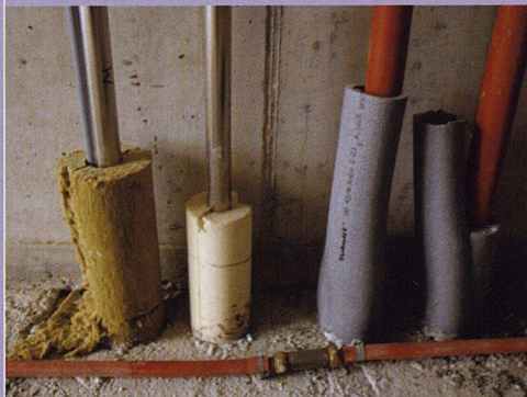
Siedlung Werdwies: Die bauökologischen Vorgaben erstrecken sich auf alle möglichen Materialien: Spanplatten, Farben, Kabelverkleidungen usw.