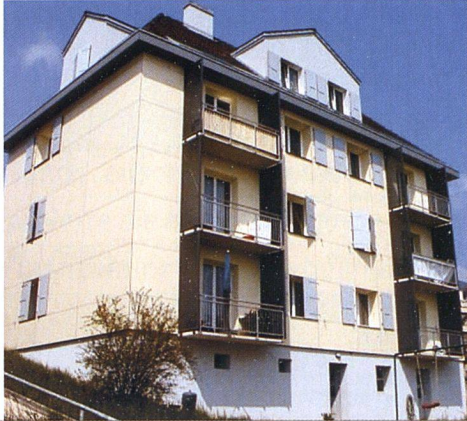
Das Mehrfamilienhaus «Bâtiment locatif» in Neuenburg wurde nach dem Minergie-Standard saniert. Die Energiebezugsfläche von 587 m 2 wird mit einer Gasfeuerung beheizt. Für eine solche Sanierung schüttet das Gebäudeprogramm der Stiftung Klimarappen einen Förderbetrag von rund 25 000 Franken aus.

VON MARION SCHILD ■ Wegen der konstant hohen Preise für fossile Brennstoffe sind automatisierte Pelletöfen ins Blickfeld der Hauseigentümer geraten. Das gilt im Speziellen bei grösseren Objekten, Mehrfamilienhäusern oder ganzen Siedlungen. Gross müssen sie mit einer Mindestleistung von 300 kW auch sein, die neuen Holzheizungen, damit die Anlagen vom Kanton Zürich als förderwürdig erachtet werden. Nur wenn sich die öffentliche Hand mit mindestens 30 Prozent an der Investition beteiligt, werden auch Holzheizungen mit 150 kW Leistung berücksichtigt. Für die Erstellung von neuen Holzheizungen und damit versorgte Wärmeverbunde (Wärmenetze) können Förderbeiträge abgeholt werden. Die konkrete Bemessung richtet sich nach der nutzbaren Jahresenergiemenge, pro MWh gibt es 100 Franken (Tabelle unten). Die Feinstaubbelastung der Luft durch Holzheizungen ist im letzten Winter fast ebenso heftig kritisiert worden wie die hohen Öl-