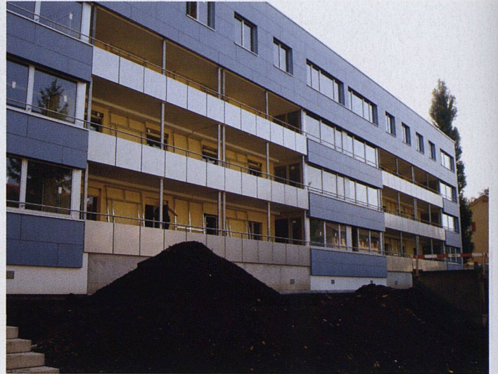
Die 40er-Jahr-Altbauten vor der Erneuerung (mit bereits vollendetem Langbau Unterfeldstrasse) sowie erstes erweitertes und saniertes Haus.

hängte, hinterlüftete Lösung mit 16 Zentimetern Dämmung und Eternitabdeckung. Auf eine Zertifizierung nach Minergiestandard verzichtete die Genossenschaft, da sie keine kontrollierte Lüftung einbauen wollte und der Lärmschutz durch den neuen Zwischenbau