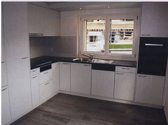
Blick in die Küche: zeitgemässer Komfort.