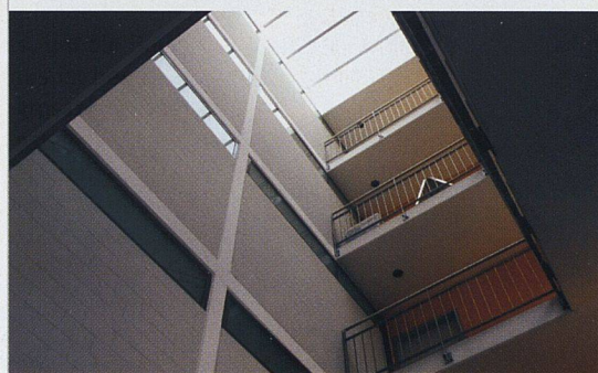
Der neue Langbau an der Unterfeldstrasse besitzt attraktive Treppenhäuser.