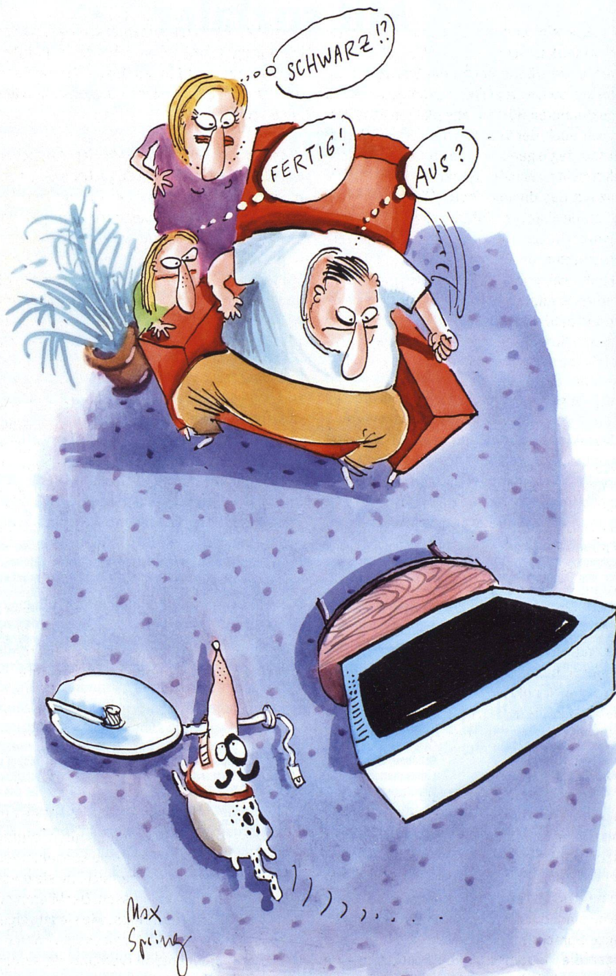
Illustration: Max Spring

Erst im 2003 gelangt es der Cablecom, mit einer Umschuldungsaktion den unternehmerischen Spielraum zu sichern. Zwei Jahre spä-