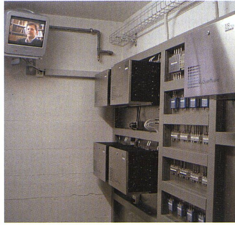
Über eine Kopfstation werden mehrere Haushalte einer Siedlung mit Fernsehprogrammen versorgt.