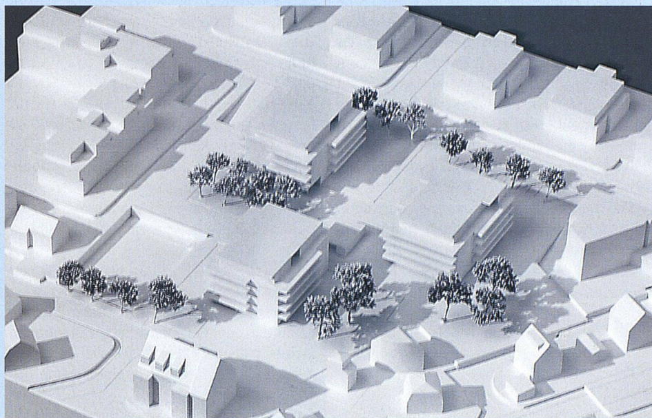
Das Projekt der asa Arbeitsgruppe für Siedlungsplanung und Architektur AG sieht drei Punkthäuser vor, die einen attraktiven zentralen Platz bilden. In einem der Häuser möchte die Gewo Züri Ost ein Angebot für Menschen in der Nach-Familienphase schaffen.