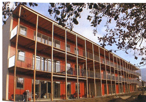
Eine knallrote Fassade und durchgängige Laubengänge verleihen den langen Baukörpern ein unverwechselbares Gesicht.