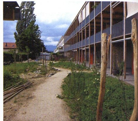
Der Naturgarten wird sein definitives Gesicht erst in etwa zwei bis drei Jahren erhalten.

nungstypen zu schaffen, insbesondere 3-, 4-, 5- und 6-Zimmer-Wohnungen, wobei die Küche ebenfalls als ein Zimmer zählte. Andere bewusste Entscheidungen waren: eine minimale Zimmergrösse von zwölf Quadratmetern, eine zum Wohnraum offene Küche, ein Maximum an Fenstern, um vom Tageslicht zu profitieren und die Stromkosten zu senken, gemeinschaftliche Räume wie eine Werkstatt, eine gegen den Gemeinschaftsgarten orientierte Waschküche, einen Gewerberaum, der auch eine Verbindung zum Quartier schaffen soll, ein gemeinsames Esslokal und – Pünktchen auf dem i – ein Gästezimmer, das gratis zur Verfügung gestellt wird.