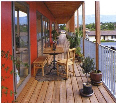
Kommunikatives Konzept: Wohnräume und Küche führen auf die durchgehenden Laubengänge und den gemeinsamen Garten hinaus.