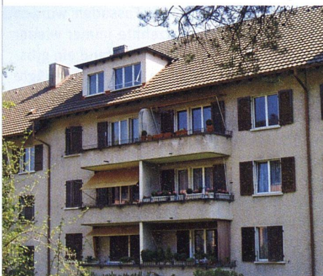
Ungenügende Wärmedämmung und kleine Balkone zeichneten die Häuser aus den späten Vierzigerjahre aus (Stoosstrasse; neu siehe Seite 19).

GRÖSSERE WOHNUNGEN. Wie in vielen anderen Genossenschaftsbauten aus den 50er-Jahren entsprechen auch die Grundrisse der EBG-Siedlung Holligen kaum mehr den heu-