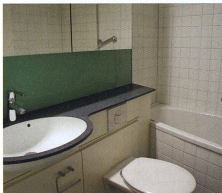
Alle Bäder wurden komplett erneuert. Pro Bad benötigte man nur zehn Arbeitstage.

die neuen, wesentlich breiteren Balkone (2,3 Meter) kamen auf dem gleichen Weg zurück. Sie wurden mit Aufschlagwinkeln sowie Stützen fixiert. Einziger Nachteil: Sie nehmen den darunter liegenden Wohnstuben etwas Licht weg. Das nehmen die Mieter aber in Kauf, denn die breiten Balkone sind wie ein zusätzliches Aus-