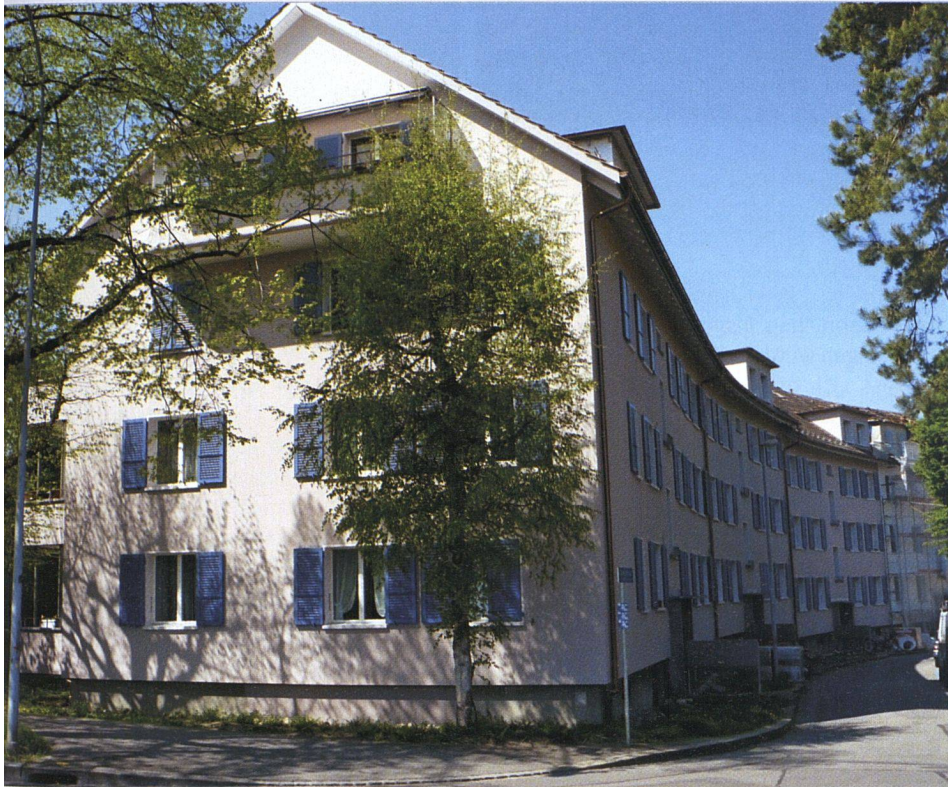
Nach der Rundumsanierung strahlt die Siedlung Holligen der EBG Bern in neuem Glanz (Stoossstrasse).

Die Häuser der Siedlung Holligen der Eisenbahner-Baugenossenschaft Bern waren in die Jahre gekommen. In mehreren Etappen hat die Genossenschaft deshalb Gebäudehülle, Balkone und Badezimmer saniert. Weil die Grundrisse der 112 Wohnungen kaum mehr heutigen Ansprüchen entsprechen, wurde ein Teil zu attraktiven Grosswohnungen zusammengelegt.