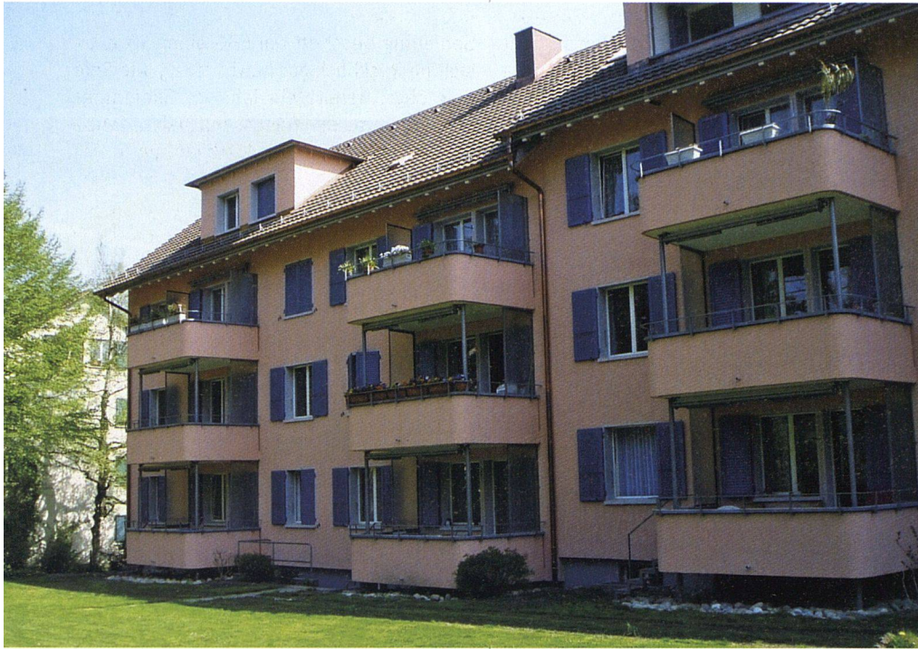
Alle Wohnungen der Siedlung Holligen erhielten neue Balkone. Die Denkmalpflege verlangte, dass die abgerundeten Ecken beibehalten werden (Scheurerstrasse).