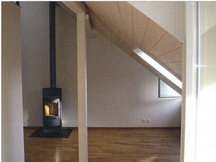
Einblicke in die vergrösserten Dachwohnungen.

DENKMALPFLEGE WILL MITREDEN. Die Denkmalpflege redete bei der Sanierung ein Wort mit. So waren etwa die bestehenden Haustüren beizubehalten und zu restaurieren. Auch die Bandbreite der Farbgestaltung bei den Fassaden war vorgegeben. Aufwändig gestalteten sich die Auflagen des Denkmalschutzes beim Ersatz der schmalen Balkone mit den abgerundeten Ecken. Die Eckform war beizubehalten. In allen Normalgeschoss-Wohnungen wurden die alten Balkone mit der Trennscheibe abgesägt und per Pneukran weggehievt; ►