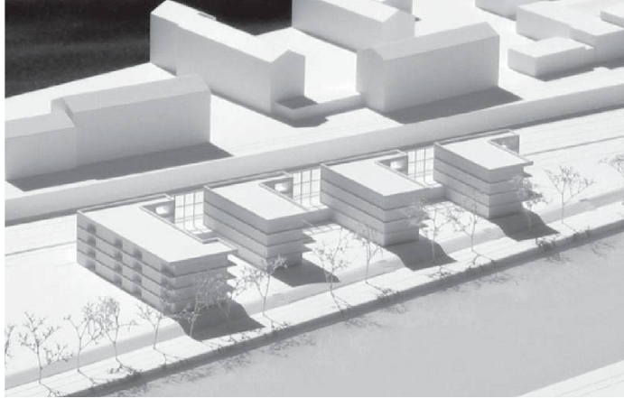
Die vierzig Neubauwohnungen liegen am Ufer der Limmat.