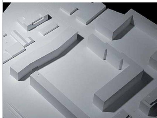
Der leicht geknickte Neubau Aspholz Süd bildet den Abschluss einer Hofsituation.

Die Jury entschied sich für das Projekt von Darlington Meier Architekten, Zürich, das einen siebengeschossigen Baukörper vorsieht. Mit seiner zweimal leicht geknickten Form bildet er einen eigenständigen Abschluss des Hofes. Die im Erdgeschoss vorgesehenen Atelierwohnungen können als Kleinläden, Büros oder Arbeitsräume genutzt werden und erlauben so die Kombination von Wohnen und Arbeiten. Die Wohnungen reichen über die ganze Fassadentiefe und weisen damit, zusammen mit den grossen Fenstern, gute Lichtverhältnisse auf. Sie besitzen auf der Westseite eine Loggia, gegen den ruhigen Hof einen Balkon. Besonders attraktiv sind die auf der