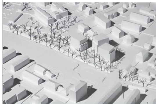
Drei markante sieben- bis achtgeschossige Bauten beherbergen 75 Alterswohnungen sowie eine Kinderkrippe und ein Elternzentrum.

zwei Himmelsrichtungen. Dank der Rücksprünge halten die Architekten den Wohnungsschlüssel ein; die Wohnungen werden nach oben hin kleiner. Die Jury lobt insbesondere die städtebauliche Situation: Die dichte Setzung der Baukörper verknüpft Strassen- und Grünraum in ungezwungener und eleganter Weise.