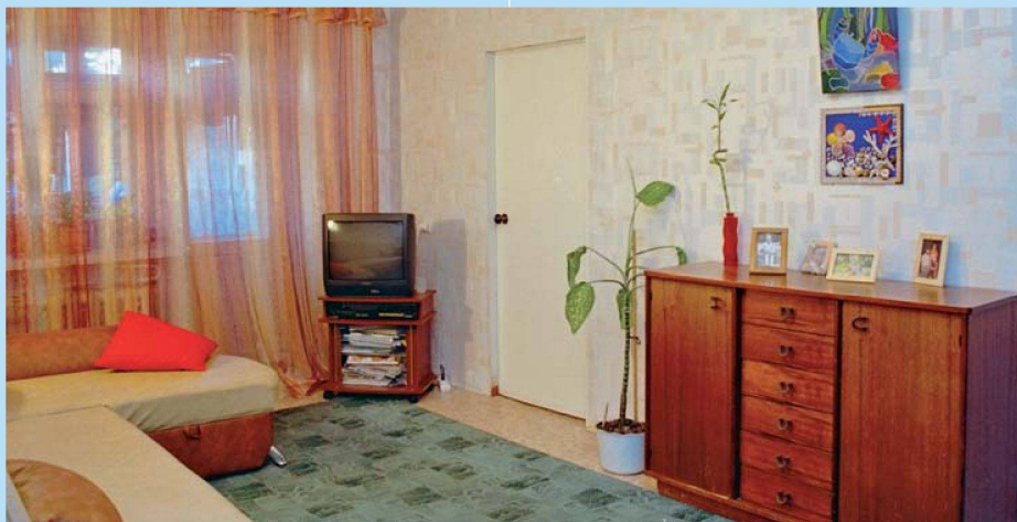
Wohnzimmer in Kazan, Russland.

Nach ihrer Reise durch Osteuropa bis nach Sibirien kommt die Wanderausstellung «Türen auf – wie wohnen wir, wie wohnen andere?» nach Zürich zurück, wo die Idee entstand. Für das Projekt haben Studieren-