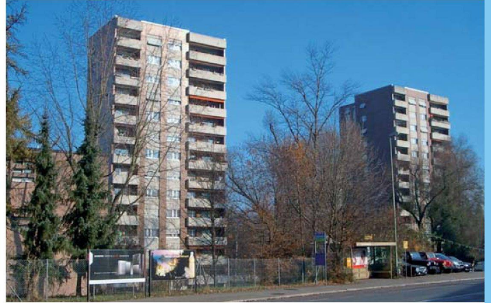
Die SGE wird ihre bestehenden 145 Wohnungen in Dietikon umfassend erneuern.

Die Siedlungsgenossenschaft Eigengrund (SGE) erstellt auf dem Areal Brunau in Dietikon vierzig Neubauwohnungen. Die Lage zwischen Limmat und Bahnlinie bietet ungestörte Sicht auf Fluss und Auenlandschaft, macht aber auch besondere Schallschutzmassnahmen notwendig. Die SBB-Station Glanzenberg befindet sich in unmittelbarer Nähe und gewährleistet damit eine ausgezeichnete Anbindung an den öffentlichen Verkehr.