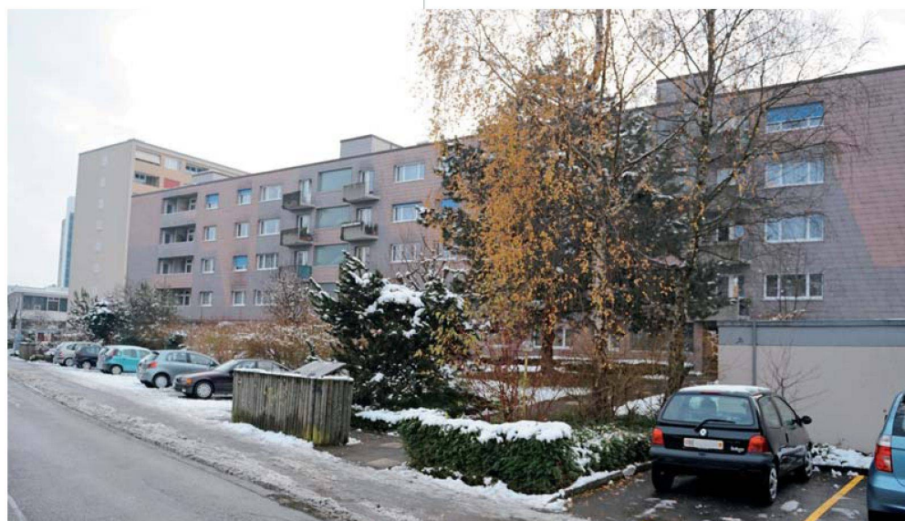
Die Siedlung Bielstrasse, wo sich die Geschäftsstelle der Genossenschaft Daheim befindet. Links das grösste Gebäu-de der Genossenschaft mit 48 Wohnungen.