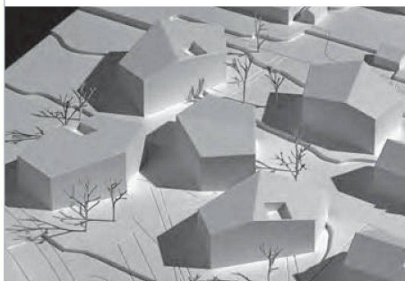
Fünfeckige Baukörper haben Architektick und Scherrer Valentin für die Gewo Züri Ost entworfen.

Das Projekt umfasst fünf fünfeckige Baukörper mit je verschiedenen Grundrissen.