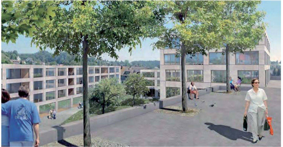
Viel Grünraum bietet die Siedlung «Station Illnau», für die kürzlich der Spatenstich erfolgte.

Die zentrale Lage mitten im Dorf und unweit von Naherholungsgebieten bietet hohe Lebensqualität und beste Erreichbarkeit für Dienstleistungen und Detailhandel. Insgesamt entstehen 74 Wohnungen, davon