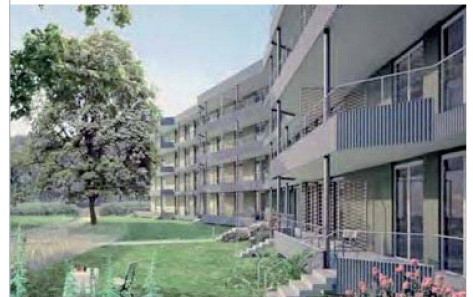
Drei leicht abgewinkelte Häuser bilden die neue Siedlung Stöckacker Süd.

die feingliedrige Siedlungsform ausgezeichnet in die architektonisch sehr unterschiedliche Nachbarschaft ein. Die Bethlehemstrasse wird zur Wohnstrasse für das Quartier aufgewertet. Die im Wettbewerbsprogramm geforderten unterschiedlichen Wohnungstypen – Familienwohnungen, Lofts, Town Houses und Wohnen im Alter – setzt das Projekt mit einer Durchmischung der Wohnformen um. Mit Baubeginn kann im Herbst 2012 gerechnet werden. (Weitere Informationen: www.stoekackersued.ch )