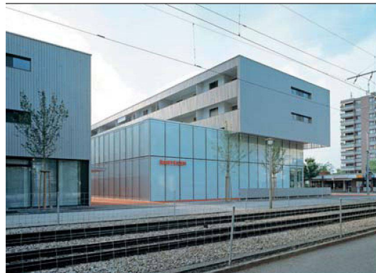
Moderne Architektur und Alterswohnen – kein Widerspruch.