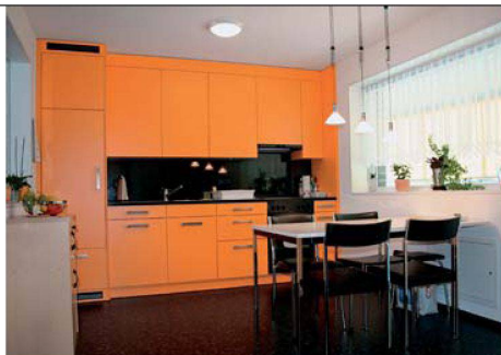
Bei allen Wohnungen tritt man direkt in die offene Wohnküche.