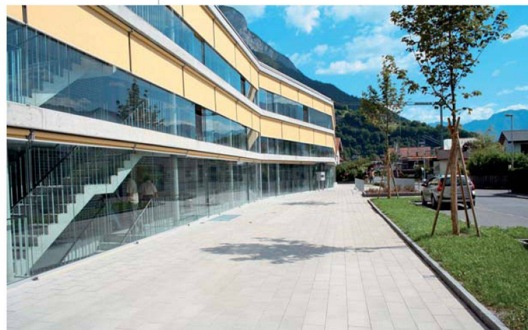
Die Sonnenstoren reagieren automatisch auf den Lichteinfall und verhindern zu hohe Temperaturen in den Begegnungszonen.