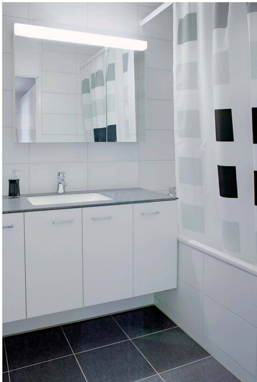
Zwischen den alten (rechts) und neuen Bädern liegen Welten.

Die umfassende Sanierung startete 2007 mit einer detaillierten Standortbestim-