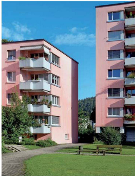
Die Totalsanierung von 128 bewohnten Wohnungen erforderte eine straffe Planung. Die Arbeiten in den Wohnungen wurden strangweise durchgeführt, pro Strang standen vier Wochen zur Verfügung.

Die grösste Herausforderung dieser intensiven Sanierungsarbeiten war es, die damit verbundenen Einschränkungen und Belastungen für die Mieter so tief wie möglich zu halten. Lärmemissionen, Schmutz und Umtriebe waren nicht zu vermeiden. Entsprechend wichtig war es, speziell den Zeitaufwand für die Arbeiten in den Wohnungen auf ein Minimum zu reduzieren. Keine leichte Aufgabe bei 128 Wohnungen. Minutiöse Planung war hier die Grundvoraussetzung für eine reibungslose, schnelle und