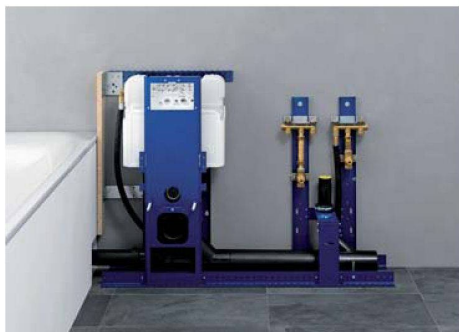
In drei Schritten zur neuen Toilette-/Waschtischkombination: Das Sanitärelement enthält bereits alle notwendigen Anschlüsse und kann direkt an die verputzte Wand montiert werden.

fristgerechte Durchführung. Im Taktfahrplan wurden die einzelnen Wohnungen strangweise saniert: Abbruch der Kücheneinrichtung, zum Teil Abbruch von Wandstücken, im Bad Abbruch der bestehenden Einrichtung und von Trennwänden, Ersatz sämtlicher Leitungen und Apparate, Einbau der neuen Küche und des neuen Bades, Plättli verlegen, malen, gipsen, Schlussreinigung. Ab Februar 2009 sanierte man so bis Ende August Strang für Strang. Pro Strang waren vier Wochen vorgesehen.