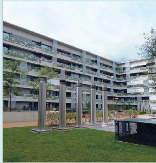
Passivhaus Lodenareal: Mit 354 Wohnungen die zurzeit grösste Passivhaus-Siedlung Europas.

widmeten sich auch der Frage, ob das Passivhaus zu einem Standard des gemeinnützigen Wohnbaus wird. Die Meinungen darüber waren geteilt. Zwar war man sich mehrheitlich einig, dass sich die Mehrkosten für den Passivhausstandard langfristig auszahlen, gleichzeitig war heftig umstritten, ob es sich lohnt, Altbauten auf diesen Standard zu sanieren, sind doch die Kosten dafür teilweise sehr hoch. Zur Energieeffizienz tragen aber nicht nur die Bauten selbst, sondern auch das Nutzerverhalten und die Stadtplanung bei, so ein anderes Argument. Das Fazit der Veranstaltung: Die gemeinnützigen Bauträger können in diesen Fragen mehr Verantwortung übernehmen, ihr Handlungsspielraum ist aber beschränkt. Energieeffizienz ist darum auch eine Herausforderung der Demokratie. (ho)