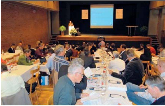
«Bildung» lautete das Thema der diesjährigen Grenchner Wohntage.