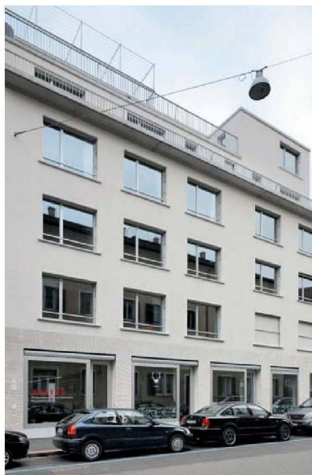
Von aussen fügt sich der Neubau diskret in die Baulücke ein. Im Erdgeschoss bezog die Geschäftsstelle der Wogeno Zürich neue Büros.