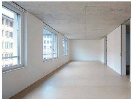
Sesam schliesse dich: der hintere Raum kann wahlweise abgetrennt (links) oder offen gelassen werden.