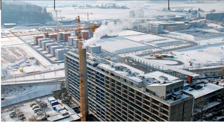
Block A wiederum mit bereits erneuerter linker Gebäudehälfte. Im Hintergrund das heranwachsende Quartier Brünnen mit Siedlungen der FAMBAU (rot), der Baugenossenschaft Brünnen-Eichholz (grau) sowie dem Einkaufszentrum Westside (rechts oben).