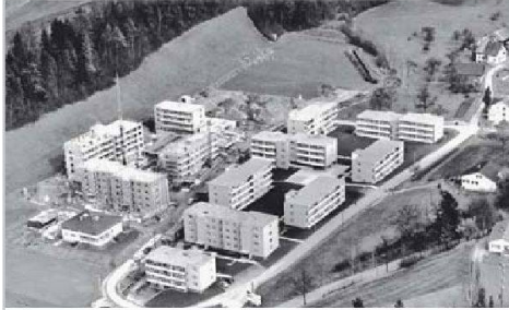
Blick auf das Weier-Quartier, wo Anfang der 1970er-Jahre die zweite Bauetappe läuft.

Im Mai 1961, nur 14 Monate nach der Genossenschaftsgründung, konnte man zum Spatenstich schreiten – noch im gleichen Jahr zogen die ersten Mieter ein. Schlag auf Schlag erstellte die Genossenschaft weitere Bauten, bis sie 1975 stolze 234 Wohnungen besass. Nun folgten harte Jahre, waren die Industriedörfer im Zürcher Oberland doch von der Rezession be-