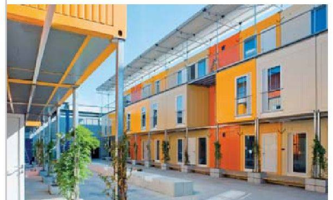
Das Containerdorf für Asylsuchende strahlt bei aller Einfachheit eine gewisse Wohnlichkeit aus.

Heineken-Areal in Leutschenbach, wo in einigen Jahren eine Wohnsiedlung entstehen soll, stehen siebzig vorgefertigte Raummodule (Container) zur Verfügung. Dort sind bereits die ersten der rund neunzig Bewohnerinnen und Bewohner eingezogen. Eine zweite Containersiedlung für rund 140 Asylsuchende nimmt die Stadt an der Aargauerstrasse in Altstetten in Betrieb. Mit insgesamt acht Millionen Franken sei die Unterbringung zwar nicht günstiger als in zugemieteten Wohnungen, war an einer Medienveranstaltung zu erfahren. Dafür können die Siedlungen rasch wieder abgebaut und an einem anderen Ort oder für einen anderen Zweck problemlos wieder aufgebaut werden. Der Aufbau dauert gerade zwei Monate. Das Konzept könnte auch