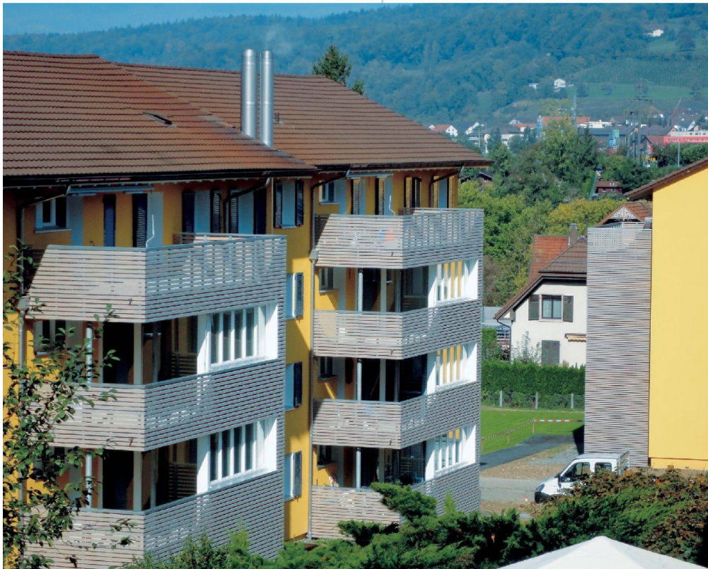
Blick auf zwei Gebäudezellen: Die neuen Anbauten bestimmen das Erscheinungsbild.

Kam hinzu, dass sich die Genossenschaft bei einer anderen Siedlung in Baden bereits