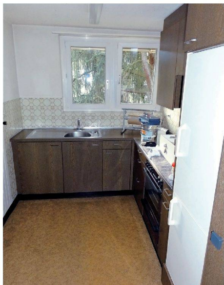
Küchen und Bäder bieten wieder heutigen Komfort (links: Küche im früheren Zustand).