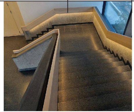
Insbesondere im Eingangsbereich und im Aussenraum sind LED-Lampen sehr geeignet. Im Bild der Empfangsbereich der Wohngenossenschaft Chrischona in Basel.