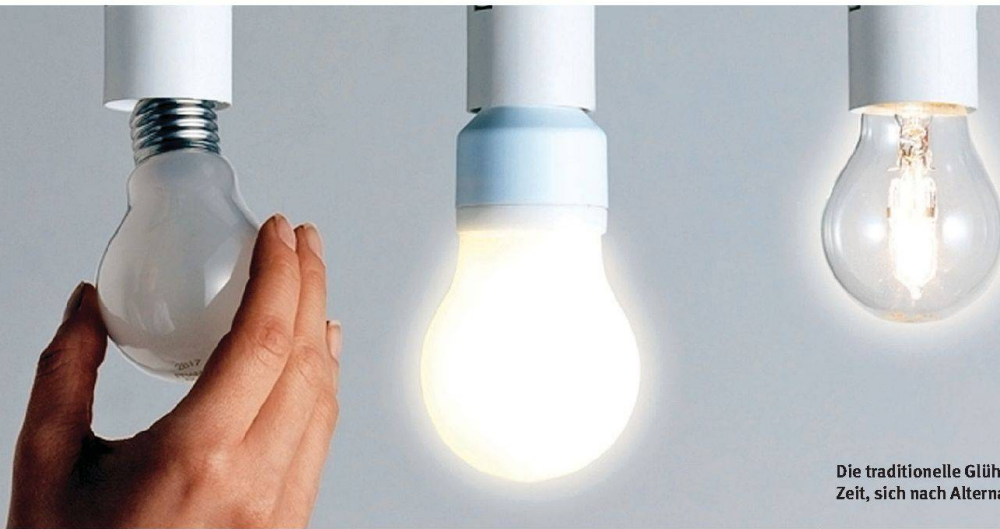
Die traditionelle Glühlampe hat bald ausgedient. Zeit, sich nach Alternativen umzusehen.

Traditionelle Glühlampen sind ab nächstem Jahr nicht mehr zulässig. Dann müssen auch Liegenschaftsbesitzer bei der Beleuchtung von Aussenraum und Erschliessung umdenken. Stromsparlampen, Eco-Halogenlampen und LED-Leuchten bieten sich als ökologischere Alternativen an und ermöglichen ganz neue Lichteffekte. Was es dabei zu beachten gilt.