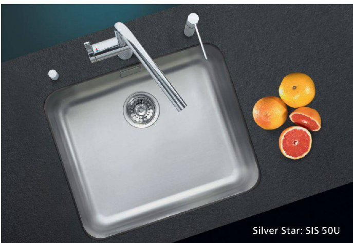
Silver Star: SIS 50U

ROBERT SPLEISS AG Bauunternehmung · Seestrasse 159 · CH-8700 Küsnacht · Telefon 044 385 85 85 · Telefax 044 385 85 07 · www.robert-spleiss.ch