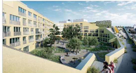
Urban, aber grün: So soll sich die Siedlung Kalkbreite dereinst präsentieren.

schaft verzeichnet bereits 500 Mitglieder, unter denen die Wohnungen noch in diesem Jahr ausgeschrieben werden. Insgesamt werden 88 Einheiten mit 1 bis 1½ Zimmern zur Verfügung stehen.