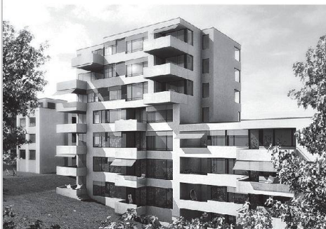
Ergänzungsbauten der Stiftung PWG an der Sihlweid- und an der Militärstrasse in Zürich.

Gleich zwei Neubauvorhaben meldet die Stiftung zur Erhaltung von preisgünstigen Wohn- und Gewerberäumen der Stadt Zürich (PWG). An der Sihlweidstrasse in Mittelleimbach erweitert sie eine Überbauung aus den 1970er-Jahren mit einem Neubau. 61 Architekturbüros hatten sich für eine Teilnahme am anonymen Wettbewerb beworben, den schliesslich Guignard & Sanner Architekten AG aus Zürich gewannen. Der Erweiterungsbau ist direkt an den Bestand angebaut und schafft 14 nutzungsneutrale zusätzliche Einheiten. Beim zwei-