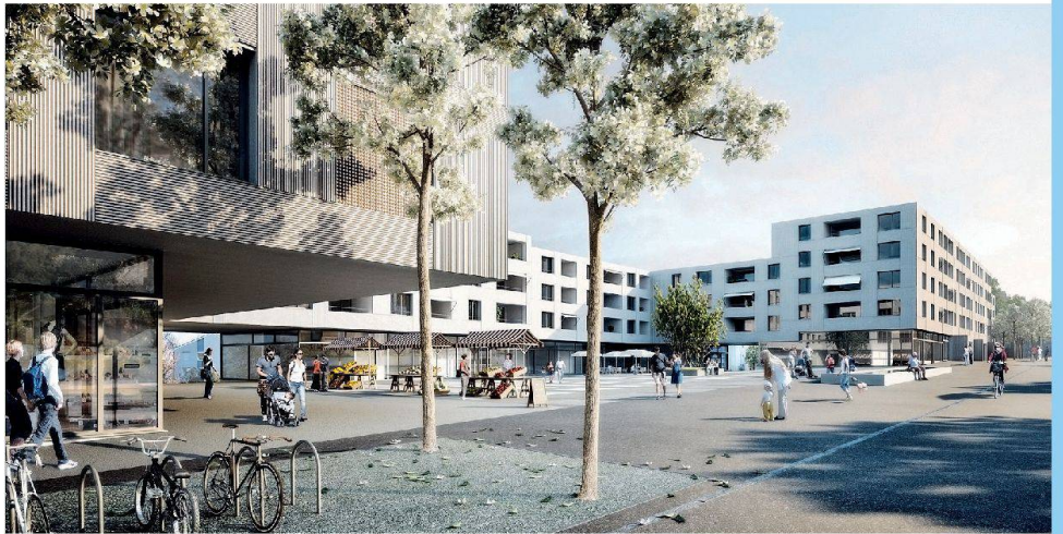
Projekt von Enzmann Fischer für die neue Zentrumsüberbauung am Friesenberg: Zwei attraktive Plätze entstehen.

Die Anforderungen an die neue Überbauung sind vielfältig: Entstehen soll ein identitätsstiftender Zentrumsplatz, der das Zusammenleben fördert und gleichzeitig die Verkehrssituation an der Schweighofstrasse entschärft. Ein Restaurant, ein grösserer Coop-Supermarkt sowie weitere Läden werden die Nahversorgung im Quartier sicherstellen. Modellhaft ist das geplante Gesundheitszentrum, das mehrere Hausarztpraxen zusammenfasst. Es wird durch eine Krankenstation für die temporäre Betreuung sowie zwei Pflegewohngruppen ergänzt. Entstehen soll auch Raum für Kindergarten und Kinderhort sowie für die FGZ-Geschäftsstelle mitsamt Regiebetrieb. Die gut hundert Wohnungen sind einerseits auf die Bedürfnisse von Familien und anderen Haushaltformen mit Kindern zuge-