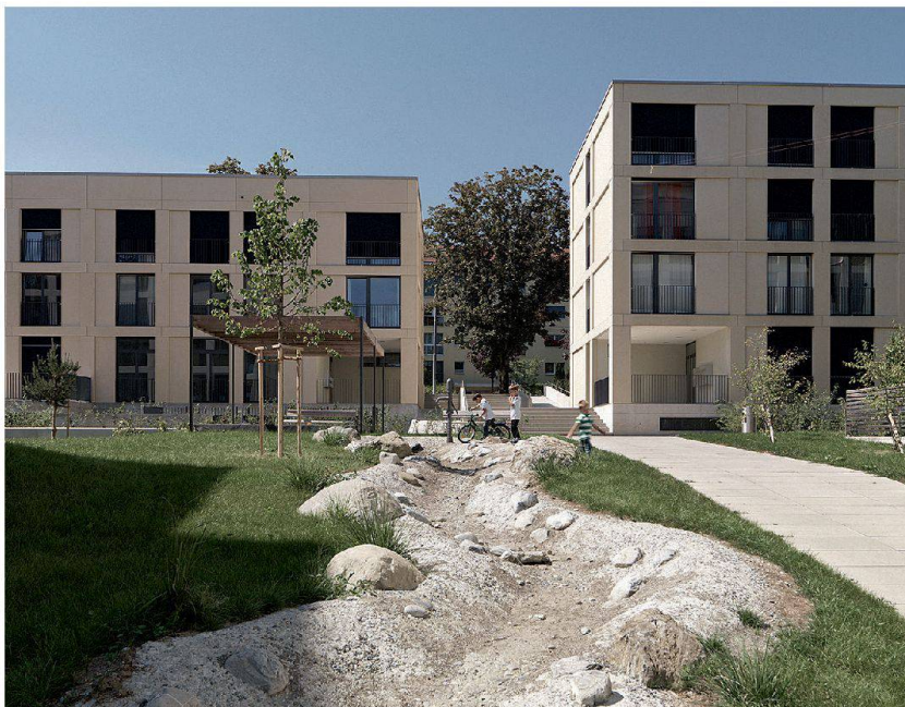
■ Dank einer Bewohnerinitiative kam unter anderem die beliebte Wasserpumpstation für die Kinder zustande.