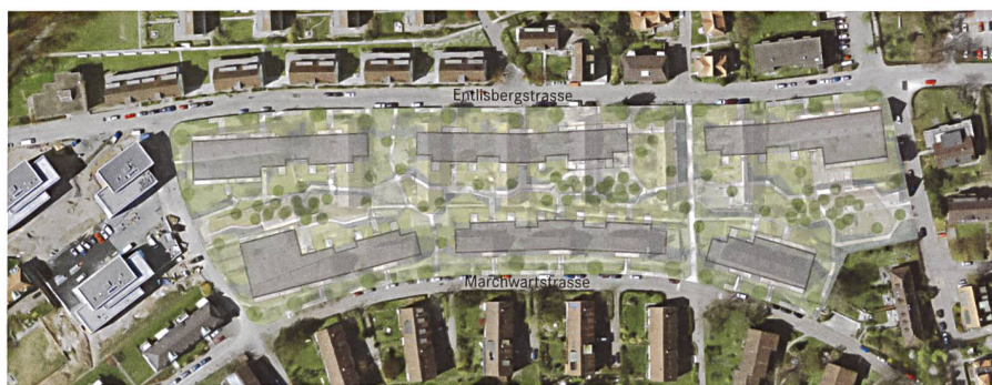
Sechs schlanke Baukörper (grau eingefärbt) ersetzen 16 ABZ-Häuser zwischen der Entlisberg- und der Marchwartstrasse.