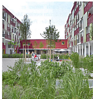
Ausgezeichnet mit dem Preis «Umsicht»: Giesse- rei in Winterthur.

Der Gesewo-Holzbau mit 155 Wohnungen sei aus städtebaulicher Sicht ein hervorragendes Beispiel für verdichtetes Bauen. Hervorgehoben wurden verschiedene ökologische und soziale Qualitäten der Giesse- rei. So erfüllte diese in hervorragender Weise die Anforderungen des übergeordneten Energiekonzepts, und Bewohnerinnen und Bewohner könnten dank eines differenzierten Wohnungsangebots über verschiedene Lebensphasen in der Siedlung wohnen bleiben. Als Plus wurden auch die zahlreichen öffentlichen Nutzungen gewertet. Von 79 eingereichten Arbeiten erhielten fünf eine Auszeichnung.