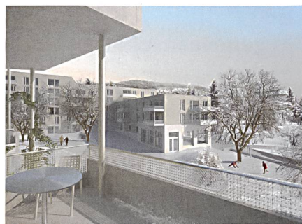
Eine der geplanten städtischen Siedlungen: Kronenwiese in Zürich Unterstrass.

sunken ist. Die Stadt will deren Anteil wieder erhöhen und bemüht sich bei der Baurechtsvergabe an gemeinnützige Wohnbauträger um entsprechende Lösungen.