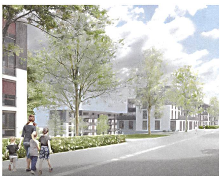
Die Visualisierung zeigt den Blick von der Entlisbergstrasse auf die geplanten Häuser.

Die Generalversammlung muss am 3. März 2014 dem 72-Millionen-Franken-Projekt noch zustimmen. Läuft alles planmässig, beginnen im Herbst 2015 die Bauarbeiten. Bezugsbereit sein sollen die Ersatzneubauten ab Mitte 2017.