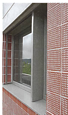
Die Klinkerfassade ist eine Neuentwicklung.

bengänge erschlossen und erhalten dank grosser Fenster viel Licht. Sie bieten allen gängigen Komfort. Mit Nettomieten von 1730 bis 1770 Franken für die 4½-Zimmer-Variante sind sie für Neubauten günstig. Bei Fertigstellung war die Hälfte der Wohnungen vergeben. Für die weitere Vermietung ist die Genossenschaft zuversichtlich, können sich die Interessenten doch nun am fertigen Objekt von der Qualität überzeugen.