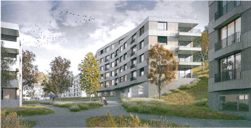
Die Neubauten werden einen grossen Siedlungsplatz bilden.

ALLGEMEINE BAUGENOSSENSCHAFT LUZERN (ABL) Die ABL erneuert ihre Siedlung Obermaihof 1, die heute 137 Wohnungen aus den späten 1940er-Jahren umfasst. Mit einer Siedlungsgliederung – Sanierungen, Erweiterungen, Neubauten – strebt die Genossenschaft einen ausgewogenen Mix von nach wie vor günstigem Wohnraum und Neubauwohnungen an. Diese komplexe Aufgabe schrieb die ABL in einem Projektwettbewerb unter acht Architekturbüros aus.