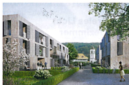
Das Projekt Kochermatte, ein Holz-Beton-Bau, entworfen von :mlzd Architekten.

KOCHERMATTE In Aegerten (BE) soll eine altersgerechte Wohnsiedlung entstehen, die auf Selbsthilfe und nachbarschaftlicher Unterstützung gründet. Der Entwurf des Bieler Büros :mlzd sieht vier dreigeschossige Längsbauten vor, die einen Zentrumsplatz offenlassen und insgesamt 32 Wohnungen bieten. Zum Raumprogramm gehört ein beträchtlicher Gemeinschaftsteil, der neben Cafeteria und Bibliothek auch einen Wellnessbereich und eine Werkstatt umfassen soll. Die Siedlung soll von einer Wohnbaugenossenschaft betrieben werden, für die derzeit Mitglieder gesucht werden; Kontakt unter www.kochermatte.ch .