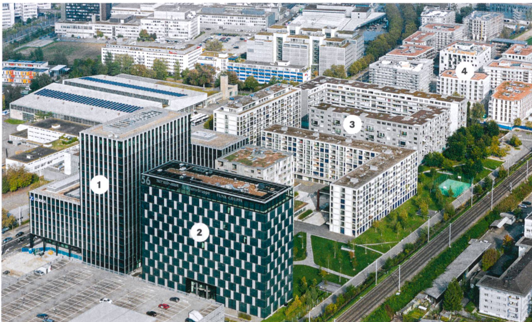
«Neubaumeile» in Zürich Leutschenbach: