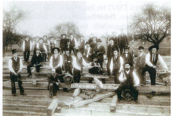
Solide Handwerkskunst: So präsentierte sich die nachmalige BWT Bau AG anno 1870.

Holzbau. Hier seien vernetztes Wissen aus allen Bausparten sowie handwerkliche Kreativität gefragt. Als mittleres Bauunternehmen kann die Firma sowohl umfangreiche Projekte als auch kleine Umbauten umsetzen und ist auch bei den Baugenossenschaften stark verankert. Zudem hat sie sich auf die Sanierung von Asbest und anderen Schadstoffen spezialisiert und in Bern, Basel, Luzern und St. Gallen Standorte eröffnet.