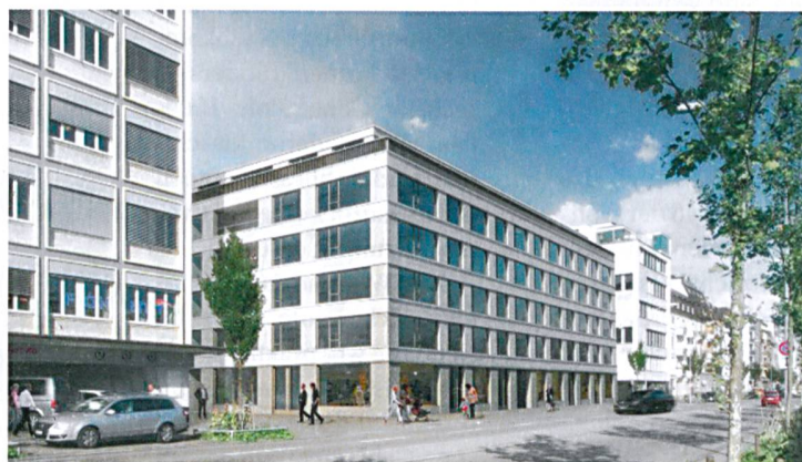
Siegerprojekt von Zita Cotti für die Alterswohnungen an der Erikastrasse.

3 1/2-Zimmer-Wohnungen geplant sind, wird der Neubau auch Paare ansprechen. Er berücksichtigt zudem das Bedürfnis nach gemeinschaftlichen Räumen und verfügt über einen ruhigen Innenhof als Begegnungszone. Die Wohnungen der SAW werden ergänzt durch ein breites Angebot an Dienstleistungen wie beispielsweise eine Spitex und Hauswartung im Haus. Anfang 2016 soll mit den Bauarbeiten begonnen werden.