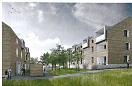
Wohnen in der zweiten Lebenshälfte: Visualisierung des Projekts Muttimatte.

BIWOG Trotz Wintereinbruch schritt der Vorstand der Bieler Wohnbaugenossenschaft Biwog gemeinsam mit Vertretern des Planungsbüros, der Gemeinde sowie interessierten Mietern zum Spatenstich für ihr Neubauprojekt in Brügg. Nach langer Planungsphase kann das 13-Millionen-Projekt in den nächsten Monaten in die Tat umgesetzt werden. Im Auftrag der Gemeinde Brügg erstellt und betreibt die Biwog im Dorfkern eine Siedlung für das Wohnen in der zweiten Lebenshälfte. Die künftigen Mieterinnen und Mieter werden in einer Hausgemeinschaft leben, in der das nachbarschaftliche Zusammenleben bewusst gefördert wird.