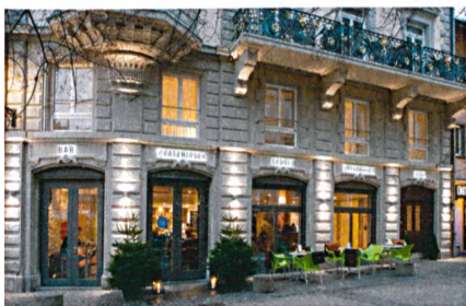
Das Hotel Platzhirsch im Niederdorf ist neu im Besitz des Sunnige Hof.

SUNNIGE HOF Die Zürcher Siedlungsgenossenschaft Sunnige Hof will künftig gewerblich genutzte Immobilien erwerben, um sie langfristig in Wohnimmobilien umzunutzen. Da für die Gewerbeobjekte meist langfristige Mietverträge bestehen, können die Immobilien vor der Umnutzung teilweise direkt abgeschlossen werden, so dass bezahlbare Wohnungen entstehen. Als erstes Objekt konnte die Genossenschaft das Hotel Platzhirsch im Niederdorf erwerben. Der Gewerbemietvertrag dauert noch rund 15 Jahre. Umgebaut wird die Liegenschaft rund zehn sehr gefragte Wohneinheiten und eine Gewerbenutzung ergeben.