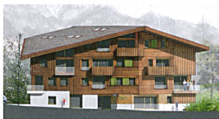
Der geplante Neubau in Château d'Ex.

schieden, der rund 15 Wohnungen umfassen wird. Das Vier-Millionen-Projekt wird unter anderem mit Mitteln aus dem Fonds de Roulement finanziert. Für Pascal Magnin, Generalsekretär des Regionalverbands Romandie von Wohnbaugenossenschaften Schweiz, ist das Projekt exemplarisch: «Es ist ein perfektes Beispiel dafür, wie sich die öffentliche Hand des Instruments einer Baugenossenschaft bedienen kann, um bezahlbaren Wohnraum zu schaffen, damit in der Gemeinde weiterhin Familien leben.»