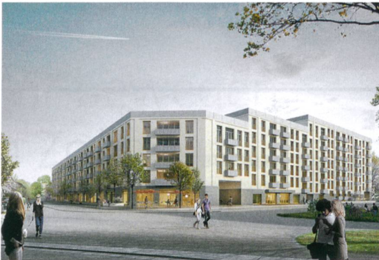
Entwurf von Müller Sigrist Architekten: markanter Abschluss gegen die Seebahnstrasse hin.

Das weitere Vorgehen: Das Siegerprojekt von Müller Sigrist Architekten wird im Juni 2015 der Generalversammlung der ABZ vorgelegt. Danach werden die überarbeiteten Siegerprojekte der ABZ und der BEP nochmals der Öffentlichkeit, dem Quartier und den Nachbarn vorgestellt. Anschliessend reichen ABZ und BEP das Gesuch an den Stadtrat für eine Inventarentlassung ein und es wird ein Gestaltungsplan ausgearbeitet. Da für den Baubeginn erst die Fertigstellung des Bauprojekts der BEP abgewartet wird, können die ersten Mieter frühestens 2022 in die neue ABZ-Siedlung einziehen.