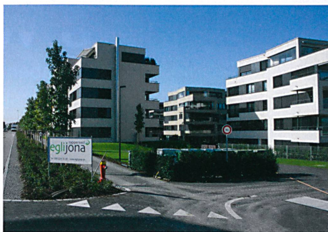
Bei der Überbauung «Lufewis» in Altendorf wurden 2300 Quadratmeter Klimaplaten verklebt.