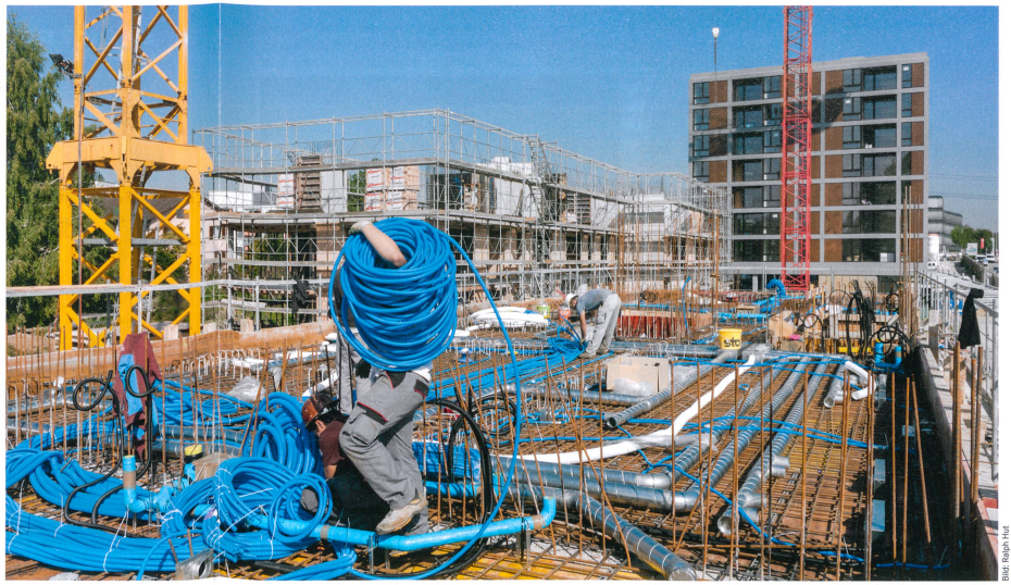
Einbau der Zu- und Abluftlüftungsrohre in der Siedlung Living 11 der ASIG. Das weit verzweigte Leitungsnetz ist an den zentralen Monoblock angeschlossen.

Auch Strömungsgeräusche der Lüftung können zu Mieterklamationen führen – obwohl sie den einzahlhaltenden Lärmwerten entsprechen. Dass sie überhaupt wahrgenommen werden, hat nicht zuletzt mit dem guten Schallschutz in modernen Gebäuden zu tun. Denn Dreifachfachverglasungen und dichte Gebäudehüllen eliminieren äussere Geräusche, womit dann an sich geringe Lärmquellen wie Kühlschränke, Geschirrspüler oder Komfort-