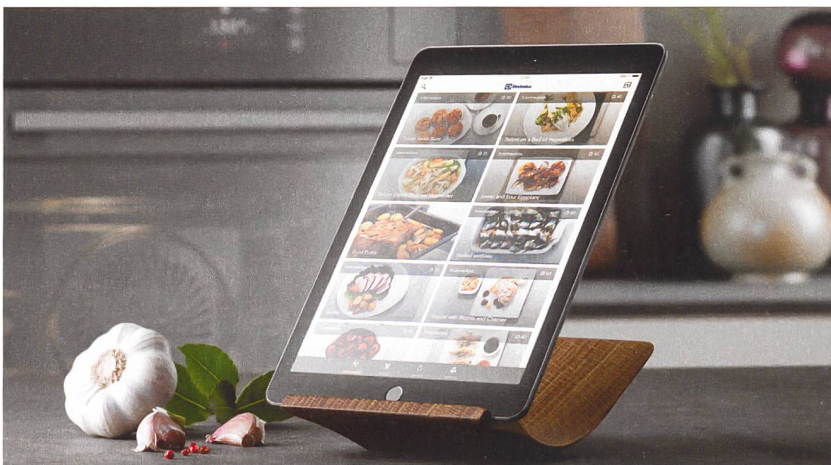
Die Electrolux-App wartet mit Rezepten und detaillierten Kochanleitungen auf.

Die neuen Apps, so die Hersteller, schonen somit den Geldbeutel und dienen der Nachhaltigkeit. Ob der Nutzer tatsächlich zum Sparen angeregt wird, wenn ihm die App mitteilt, dass der nächste Waschgang gerade mal zwölf Rappen kostet, sei dahingestellt. Immerhin: Er kann sich dank Verbrauchsmeldung freuen, dass die neuste Generation von Geschir-