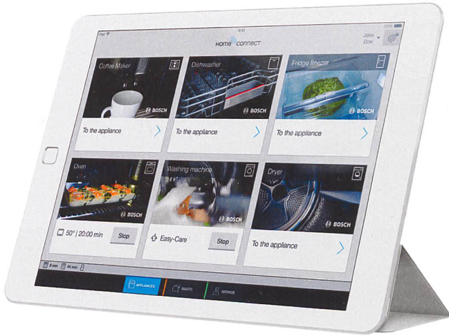
Die verschiedenen Hausgeräte lassen sich vom iPad ansteuern ...