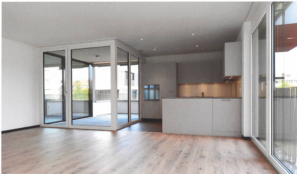
Die Wohnungen bieten eine Vielfalt an Grundrissen.