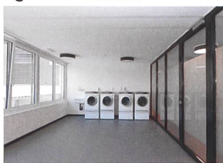
Jedes Stockwerk besitzt einen eigenen Wasorraum.