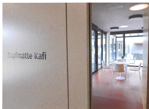
Das «Zopfmatte-Kafi» lässt sich zum anschliessenden Gemeinschaftsraum hin öffnen.

steckt aber eine weitere Idee: Die neue Siedlung spricht nämlich vor allem ältere Menschen an, die bisher im Einfamilienhaus gelebt haben. Wer dieses veräussert, könnte eine Wohnung erwerben. Wer die bisherige Behausung jedoch an die eigenen Kinder abtritt, hat die Möglichkeit, in eine der Mietwohnungen zu ziehen. Der erwünschte gesellschaftliche Effekt ist identisch: In Suhr wird wieder Wohnraum für Familien frei. Zur Finanzierung nutzte die Genossenschaft zudem die Mittel aus der Wohnbauförderung des Bundes, dem Fonds de Roulement, wobei sie durch die Erfüllung des geforderten Minergiestandards einen höheren Beitrag erhielt. Für die Restfinanzierung gewann man die Hypothekarbank Lenzburg.