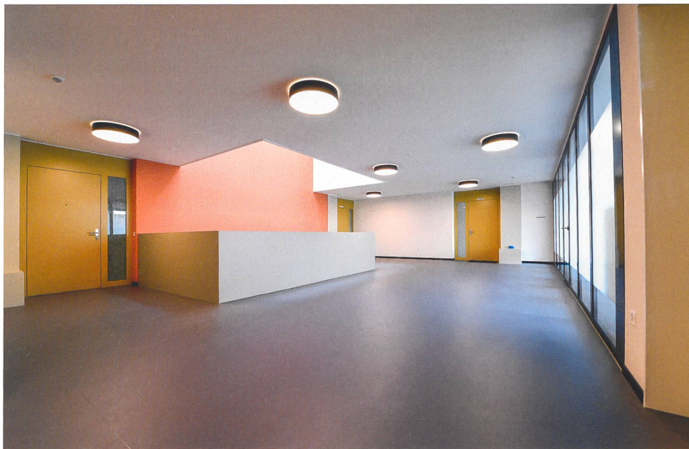
Viel Gemeinschaftsfläche gibt es auch auf den Stockwerken. Sie kann von der Bewohnerschaft nach Belieben genutzt werden.