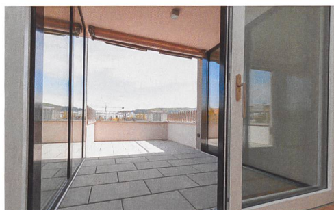
Die Balkone besitzen einen Loggienteil, in den sich zurückziehen kann.