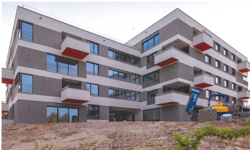
Blick von der Gartenseite – hier ist inzwischen ein parkähnlicher Aussenraum entstanden, der viele Begegnungsmöglichkeiten bietet.