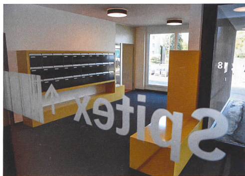
Im Eingangsbereich von Haus B befinden sich alle Briefkästen, gleich daneben liegt das Büro der Kontaktperson. Auch der Spitex-Stützpunkt ist hier eingerichtet.