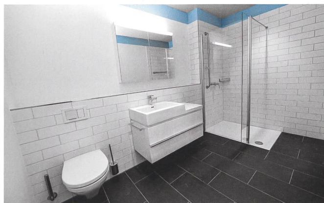
Die Badezimmer sind mit schwellenlosen Duschen ausgerüstet – und so geräumig, dass Rollstuhl und Assistenzperson bequem Platz haben.