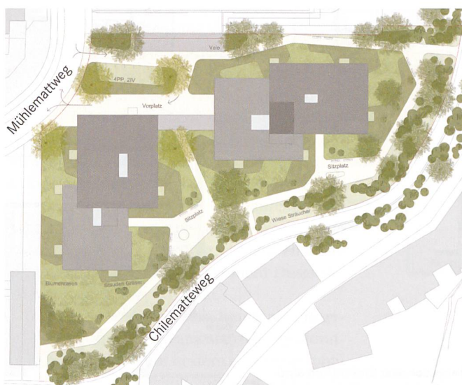
Situation der Neubausiedlung Zopfmatte.