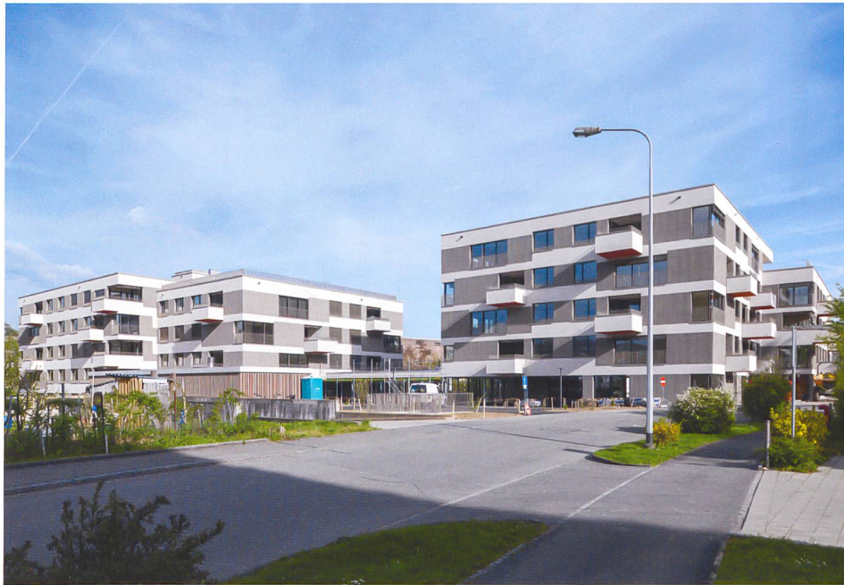
Die Siedlung besteht aus zwei orthogonal versetzten Baukörpern. Das Haus links beherbergt 26 Eigentumswohnungen, das Haus rechts den genossenschaftlichen Teil mit 30 Mietwohnungen.

Zwar diente der Eigentumsteil dazu, das Genossenschaftsprojekt zu finanzieren. Dahinter