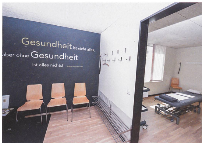
Ein eingemietetes Gesundheitszentrum bietet Physiotherapie und Kraftraum.