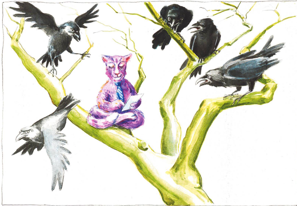
Illustration: Monika Zimmermann

Genossenschaftsmitglieder sind Menschen. Und Menschen sind manchmal «schwierig». Und weil Menschen bei den Wohnbaugenossenschaften im Zentrum stehen, bilden Kurse, die den Umgang mit den Menschen thematisieren, eine zentrale Rolle in unserem Weiterbildungsprogramm.