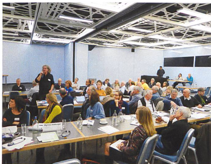
Die Delegierten melden sich zu Wort.